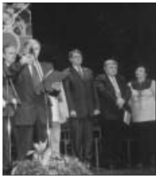
ött – 2002

ban, most is az egy átúto jelszó hiányára utal. A Munkáspárt több mindennel próbálkozik: Szociális Alkotmány! Munkát mindenkinek, teljes foglalkoztatottságot! Európai munkáért európai béreket! Ingyenes egészségügyi ellátást! Ingyenes oktatást! Az Európai Unióban is európai mezőgazdaságot! A Munkáspártra leadott szavazat nem elveszett szavazat! Kádár alatt jobb volt!