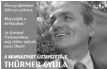
Plakát a 2004. májusi EP-választásra

1993-ban bevezetik az 5 százalékos küszöböt, s ezzel nagy lépést tesznek a kétpártrendszer felé. Ez is olyan körülmény, amelyről gyakran megfelelnek. Az emberek a két nagy csoport között ingadoznak, függetlenül azok valóságos értékeitől. Gyakorlatilag tíz év alatt lezajlik az átérés az egy-pártrendszerrel a kétpártrendszerre. 2000 elejétől minden közvélemény-kutatás nyolcvan százaléknál nagyobb összességű támogatottságot mutat ki az MSZP-nél és a Fidesz-nél. A 2002. évi listás szavazatok