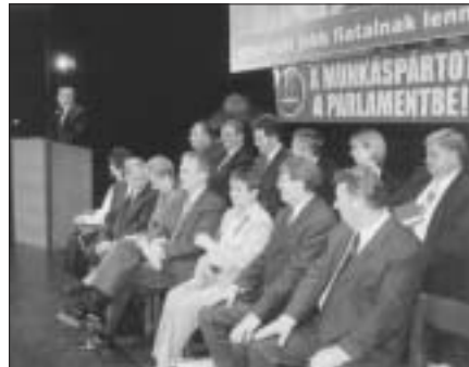
Képviselőjelöltek a 2002-es országgyűlési választáson

hető, és nagyon gyorsan ismert lesz. Jelszavak nélkül mindenkinek van valamilyen érzése a Munkáspárttól, és többnyire ennek alapján szavaz a választásokon.