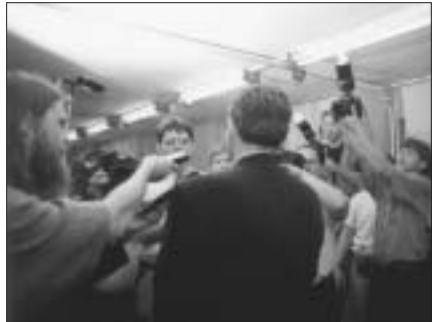
1998-as választások – a pártelnök újságírók gyűrtjében

A Munkáspárt hamar felismeri, hogy az MSZMP név az emberek szemében a múltéhoz, és a múltira való emlékeztetésnek nincs gyakorlati hasz-