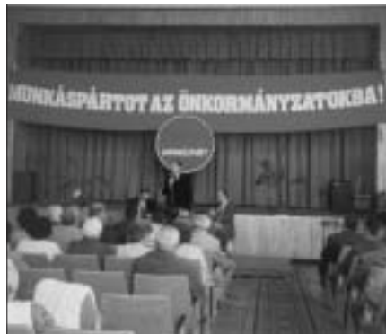
Nagygyűlés az 1998-as önkormányzati választások előtt

A Munkáspárt alapvetően tisztában van azzal, hogy szemben áll a kapitalizmussal, így a „rendszeren kívül” van. Mégis újra és újra visszaköszön a dilemma. Milyen legyen a prog-