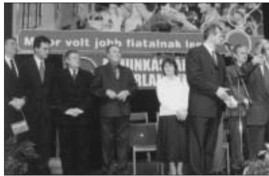
Országgyűlési választások előtt – 2002

Változnak természetesen a külpolitikai kérdések is. Eleinte