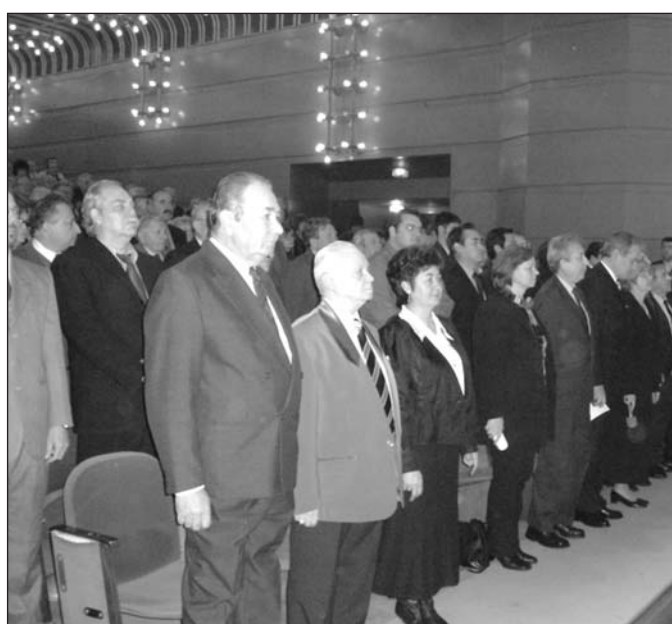
Közös emlékezés néma felállással elhunyt párttagjainkra

A párt születésnapján sem nyugszanak politikai ellenfeleink. Támadják a Munkáspártot. Eddig a szocialista múltat akarták elvenni tőlünk. De mi nem hagytuk. A szocializmus értékeit, Kádár János nevét és életművét visszük magunkkal, és tovább adjuk gyermekeinknek.