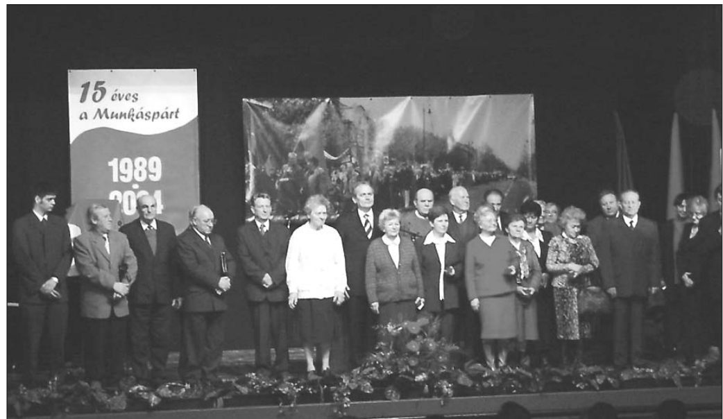
A kitüntetésben részesültek a színpadon

A rendszerváltó tőkésosztályok soha sem tudták megbocsátani, hogy élünk és időről időre megzavarjuk játékukat.