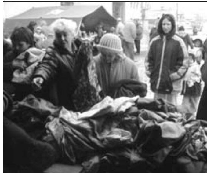
Egyre többen vannak a segítségre szorulóknak