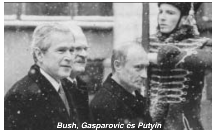
Bush, Gasparovic és Putyin

A washingtoni adminisztrációt idegesíti, hogy a nemzetközi mozgásterét bővíteni akaró Moszkva fejleszti korábbi