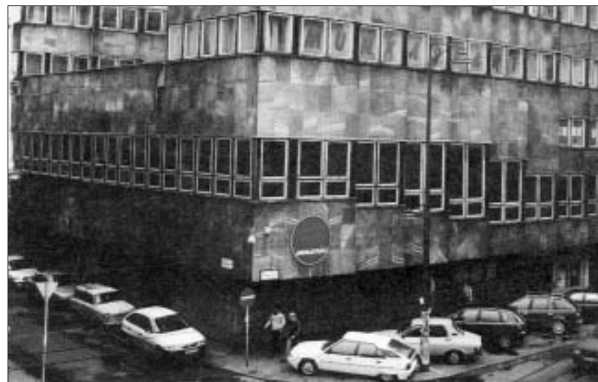
A tanácskozás helyszíne: a Munkáspárt központjának helyet adó irodaház a budapesti Baross utcában

Másrészt, a pártellenzék nem képes akarátát a párttagság mozgósítása útján sem elérni. Hiába fenyegetőznek az azl hónapok óta, hogy aláírásokat gyűjtenek és kikényszerítik az előrehozott tisztújító kongresszust, az aláírások mind a mai napig nem gyűltek össze.