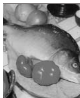
A hallé elmaradhatatlan kellékei