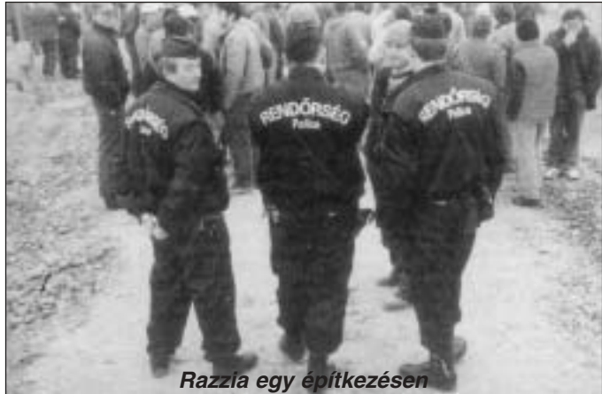
Razzia egy építkezésen

Am ha gyalog közlekedünk a városban, akkor is „eszméletlen” bűnöket tudunk elkövetni. Netán kiskutyánk végzi a dolgát, s nem szedjük fel azonnal, akkor a fölöttünk örködő kamera azonnal riasztja a közterület-felügyelő kommandóját. Persze az igaz, hogy a „nagydolgot” nagyon is illendő azonnal eltakarítani, mielőtt bárki is belépné – ámde, hogy ezt kamerákkal ellenőrizzék, az felháborító. És szerintem úgyszintén alkotmányellenes. En azt tapasztaltam, hogy a helyi kutyások keményen rászólnak arra, aki nem takarít fel a jóságát után, s ez így helyes.