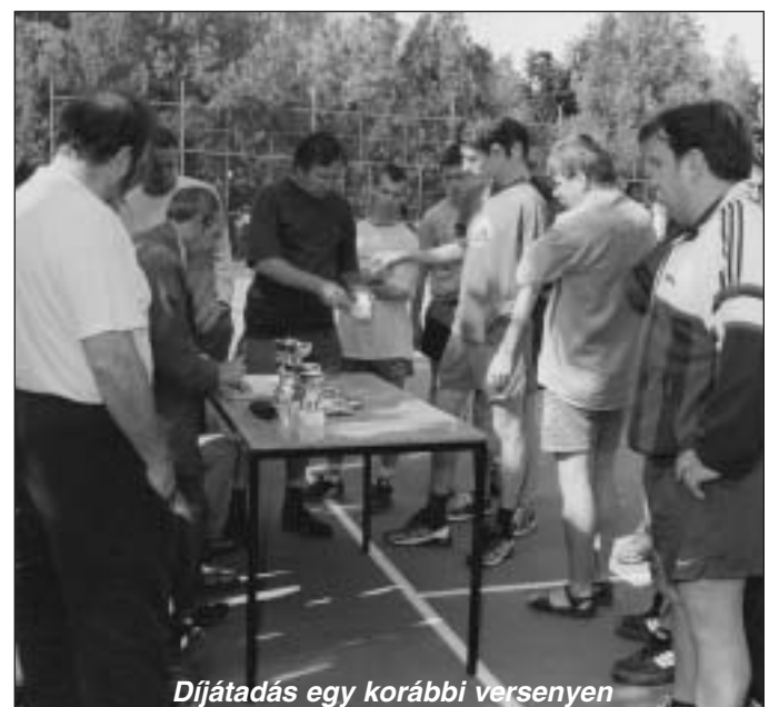
Díjátadás egy korábbi versenyen