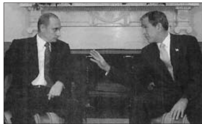
Putyin és Bush a Fehér Házban

Rigában elhangzott beszédében Bush azt javasolta a balti országoknak, hogy „mutassanak példát a volt szovjet köztár-