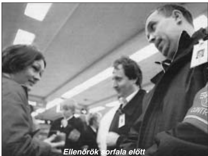
Ellenőrök sorfala előtt