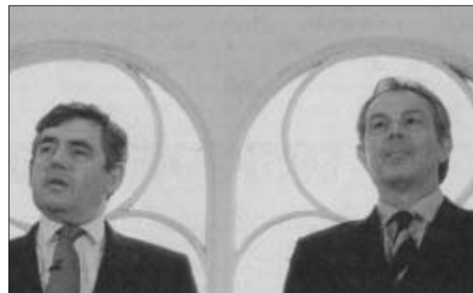
Gordon Brown és Tony Blair

Az angol belpolitika várható alakulásának az egyik kulcskérdése az Európai Unió jövője, amelynek elnöki tisztét július elsejétől, hat hónapig Nagy-Britannia látja el. Blair helyzete szorosan kötődik a május 29-ei franciaországi népszavazás eredményéhez. Francia „igen” esetén a brit kormány legkésőbb 2006 őszén kénytelen lesz a választók véleményét