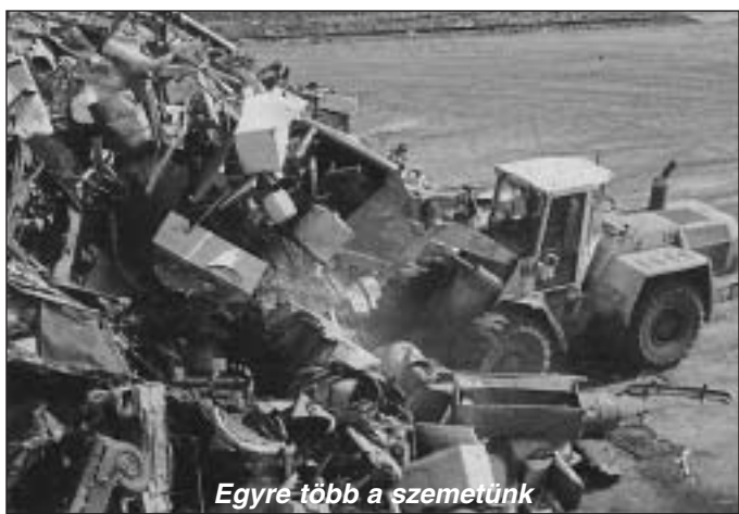
Egyre több a szemetünk