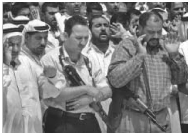
Irakiak egy meggyilkolt vallási vezető temetésén

Május 21. Irakban folytatódik a vérontás polgári áldozatokkal, magasrangú hivatalnokok halálával. A Reuters hírügynökség szerint polgárháborútól lehet tartani az országban. Amerikai katonai vezetők úgy nyilatkoztak, hogy hosszú évekig eltarthat az iraki katonai misszió.