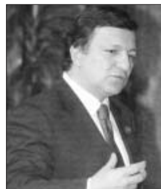
José Manuel Barroso

● Az Európai Parlament tagjai között nagy vitát váltott ki, hogy az Európai Bizottság elnökének, a portugál José