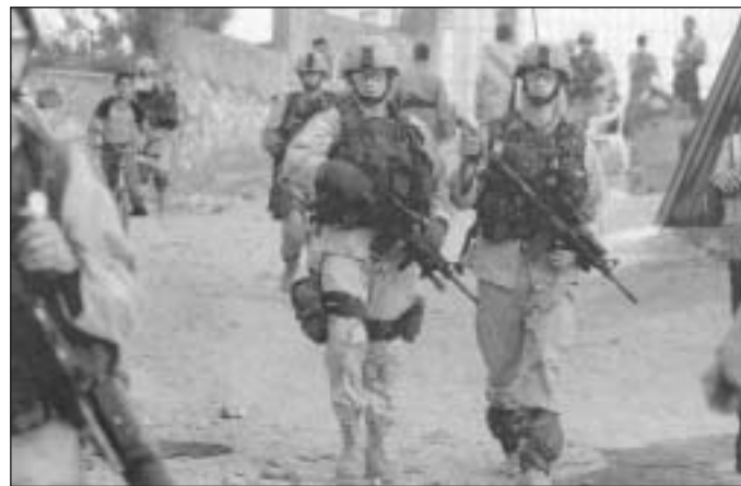
Amerikai járőrök Irakban

Kaszunei kijelentette, hogy lényeges különbség van az arab