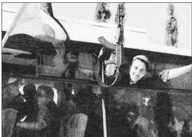
Palesztin rendőr ünnepli az izraeli kivonulást

Szeptember 11. Az utolsó izraeli katona is kivonult a Gázai övezetből, így 38 év után újra palesztin fennhatóság alá került a terület. Mahmud Abbasz, a Palesztin Hatóság elnöke szerint hónapokig eltarthat a törvényesség és a rend helyreállítása a térségben, ahol egyelőre a két szélsőséges szervezet, a Hamasz és az Iszlám Dzsihad az úr. Izrael védelmi minisztere közölte, ezentúl „zéró toleranciát” tanúsítanak a palesztin terrorcselekmények iránt.