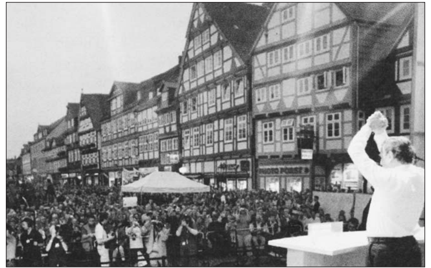
A Schröder vezette szociáldemokraták gőzerővel kampányolnak

Három párt számít a baloldali szavazók voksaira a szeptember 18-án tartandó választásokon. A Schröder-kormány neoliberais „reformjai” miatt népszerűtlenné vált szociáldemokrata SPD most egy fél „balra át”-tal próbálkozik szavazatokat szerezni. A zöldek bázisát elsősorban a nagyvárosokban élő, a párt vezetőségénél radikálisabb gondolkodású értelmiségiek és a környezetvédő mozgalmak tagjai jelentik. Az antiliberais erőket a közelmúltban alakult Baloldali Párt képviseli, amely két reaktívált politikussal, Gregor Gysivel, a keletnémet „utódpart”, a PDS alapító elnökével, és Oskar Lafontaine-nel, az SPD-nek háttal fordított volt pénzügyminiszterrel az élén új alternatívát jelent a politikai mezőnyben.