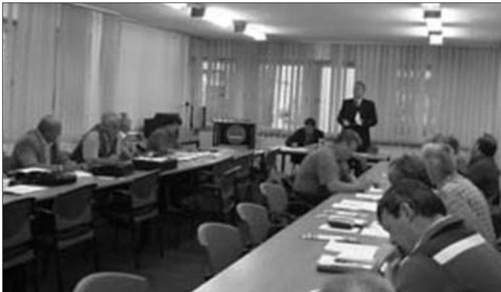
A Baross utcai székházban tanácskoznak a megyei elnökök

tozást. Veszprém megyében a korábban közölt tapalciai eredmények mellett a