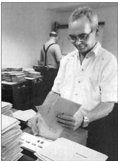
Postán érkezett szavazatokat összesítenek

ták első helyén szerepel. Egy CDU/CSU-SPD nagykoalícióban azonban a választások előtt ügyesen hajrázó Schrödernek nem lenne helye.