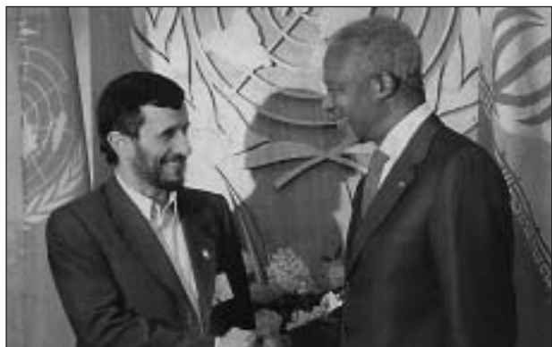
Mahmud Ahmadinedzsad iráni elnök és Kofi Annan ENSZ-főtitkár

Szeptember 17. Véget ért az ENSZ-közgyűlés hatvanadik ülésszaka New Yorkban. Az elfogadott – az eredeti tervekhez képest erősen felhígított – záródokumentum csak csekély előrehaladást hozott a szegénység és a terrorizmus elleni harc terén. Több politikus szerint gyökeres reformokra lenne szükség ahhoz, hogy az ENSZ reális erőt képviselő szervezetté váljon a XXI. században.