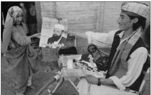
Kampányolás afgán módra

Szeptember 19. Az afgán választásokon mintegy hatezer független jelölt (senki nem pártzínében indul) versengett a képviselőházi és tartományi helyekért. A szavazásra jogosult tizenkétmillió ember közel fele „mert elmerni” a szavazóhelyiségekbe. Bár a hatóságok szerint békésen zajlott a voksolás, tálib fegyveresek így is több mint húsz helyen követtek el merényletet. Választási eredmények körülbelül egy hónap múlva várhatók.