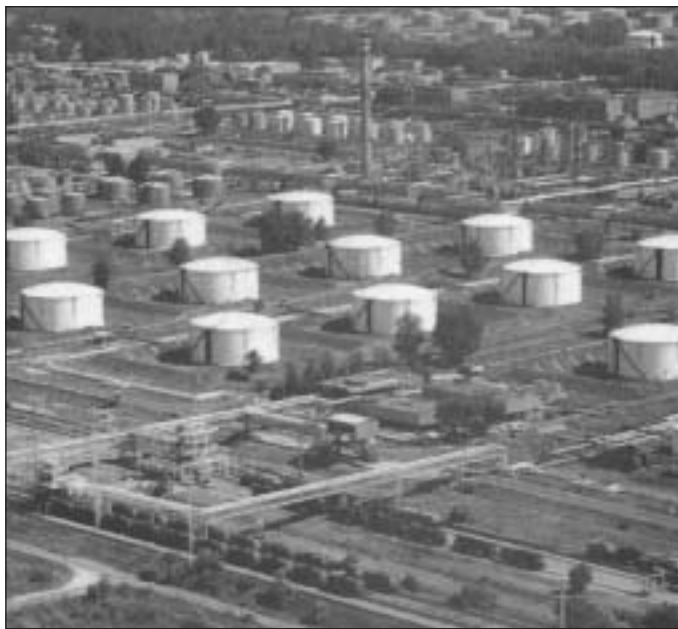
Ahová a szibériai kőolaj érkezik – Százhalombatta