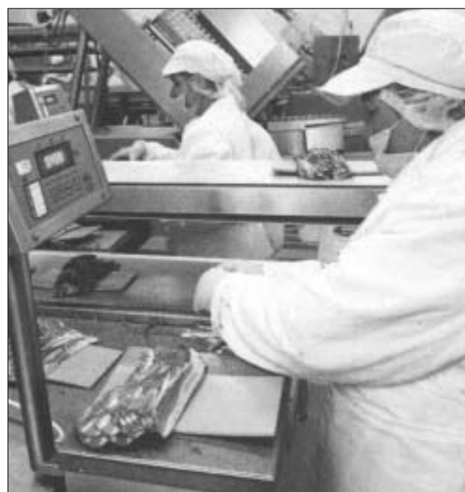
Nem mindenki állja a versenyt

– 1994-ben nagy összegű hitelt vettünk fel az üzem felújítására. A Tisza-Marosszög Télesztől vásároltuk a sertéseket, s 1999-ig negyvenötven évente négy-ötezer disznót vágunk, feldolgoztuk és értékesítettük. Aztán 1998-ban kezdődtek a gondok. A vágást ugyanis meg kellett szüntetni a higiéniai, környezetvédelmi és egyéb előírások miatt. Levágtunk sertéseket hoztunk az üzembe, ahol feldolgoztuk, aztán a termékeket eladtuk. Miután megtiltották nekünk a vágást, csökkentettük a létszámot.