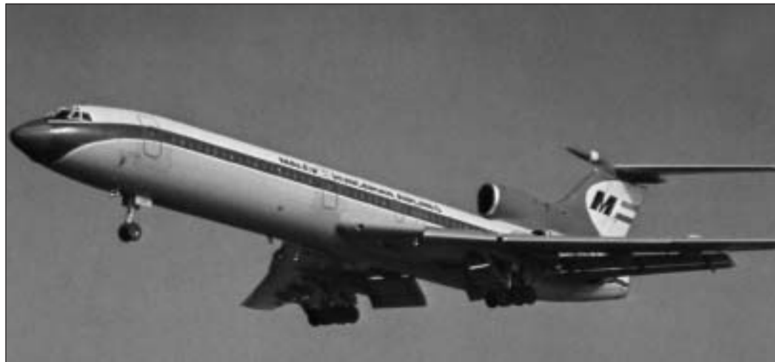
A Malév TU-154-es repülőgépe

Szakértők szerint „erőszakos hatás” következtében történt az „esemény”, és kizárható a műszaki hiba vagy a pilóta tévedésének a lehetősége. A HA-LCI-t minden bizonnyal a földről vagy egy vadászgépről indított rakétával lötték le. A tífős személyzet mellett tizenkét nemzethez tartozó, mintegy ötven utas volt a fedélzeten. Összefüggés lehet a gép tragédiája és a PFSZ budapesti irodájának szeptember 29-én, demonstratív céllal történt megnyitása között. Valószínű, hogy az akció kitervelői az eseményen részt vevő palesztin vezetőkre vadásztak, akiknek a likvidálása elsősorban a terrorista merényletek által fenyegetett Izrael és a konzervatív arab rendszerek érdekében állt. Ezt a nézetet erősíti, hogy a PFSZ prágai képviselőinek a létrehozását követően, 1975. augusztus 20-án Damaszkusz közelében lezuhant a cseh-szlovák légitársaság Il-62-es tí-