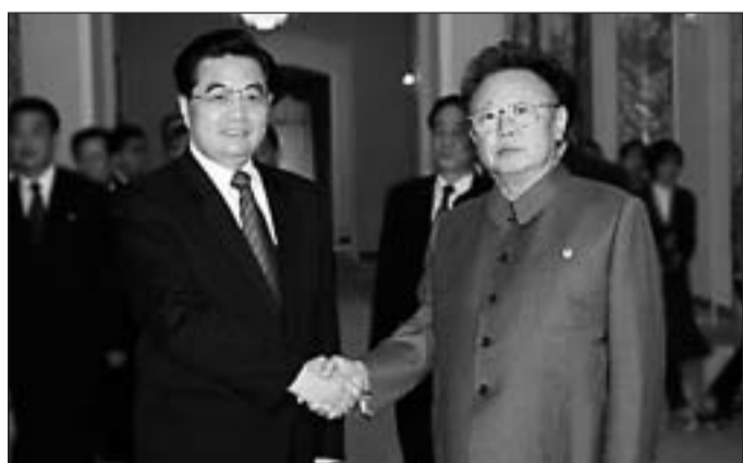
Hu Jintao és Kim Jong Il