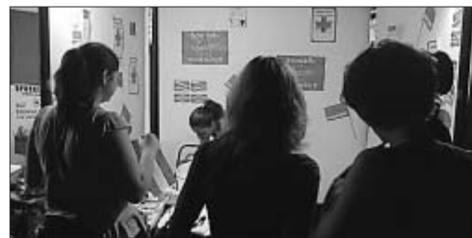
Érdeklődők a Front standjánál

Minden nap más fiatal segítőt kaptak a delegációk, aki egyrészt a fordításban, másrészt minden egyéb apró-cseprő ügyben segített nekünk. A kommunikációval nem volt gond, az angol a fiatalabbak körében jól-rosszul ugyan, de összességében általánosan beszélt nyelv, az idősebbekkel pedig angolról görög-re fordítva lehetett társalogni. Egyébként több magyarul beszélő látogatóval is találkoztam, részben idősebbekkel, akik még a hetvenes években kerültek Magyarországra és onnan tértek vissza hazájukba, másrészt