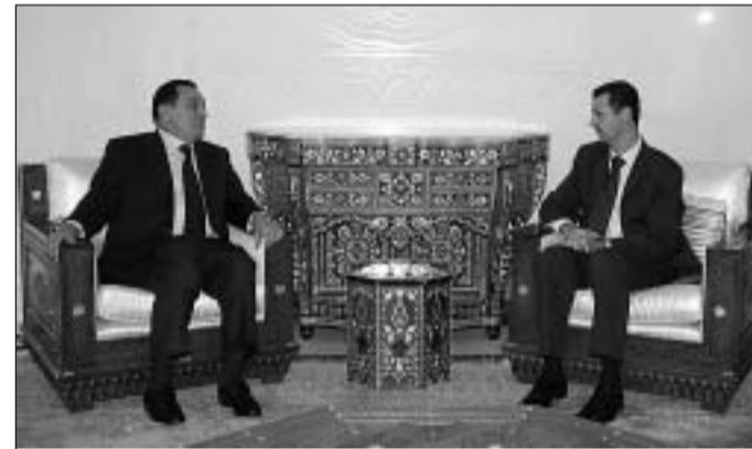
Mubarak egyiptomi és Asszad szíria elnök találkozója