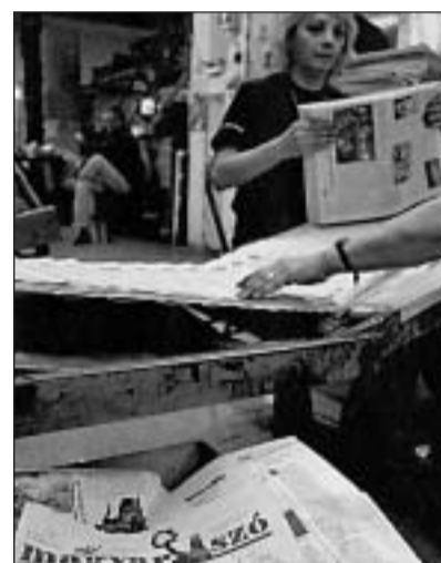
Nyomják az Új Magyar Szó című romániai magyar napilapot

mai szervezetek közötti kapcsolat ápolását és elmélyítését, a külhoni magyar újságírás szakmai hírnevének öregbítését tűzte zászlajára és híd szerepét kívánja betölteni az anyaország és a szomszédos államok között. Ugyancsak a határöntúlnak és a környező országok kapcsolatépítése jegyében zajlott le októberben a magyar-román kormányzati