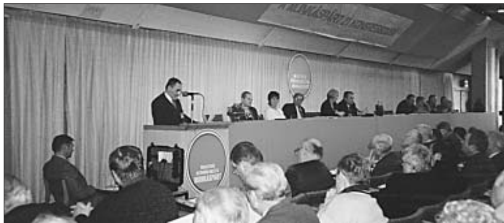
2005. december 17. – ülésezik a Munkáspárt 21. Kongresszusa

Ezek komoly nehézségek, de nem akadályozhatnak bennünket abban, hogy a lehető legjobban kihasználjuk a hátralevő időt. A választáshoz majdnem mindennel rendelkezünk. Egy dolog, ami biztosan kevés, ez az idő. A választások legvalószínűbb időpontja április 9. Lehet, hogy két héttel később lesz, ez a lényeg nem változtat. A törvény szerint hamarosan ki kell írni a választásokat. Akárhogy is nézzük, februárban várhatóan megkezdődik a kopogtatócédulák gyűjtése, márciusban a kampány, áprilisban választás. A rendelkezésre álló nagyon ke-