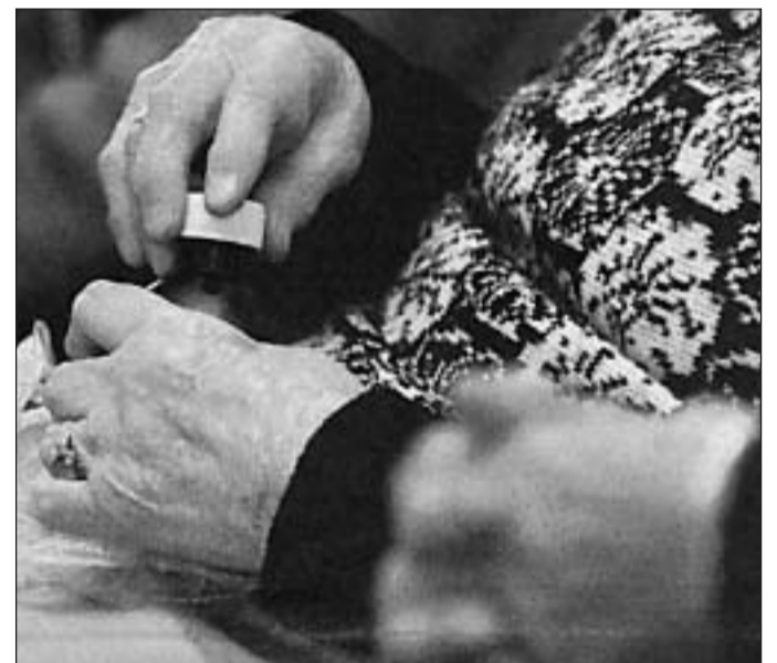
Sokaknak már nincs hova fordulniuk

– Blöff az egész híradás, néhány kalandor visszaélt a nevünkkel. Egy bizonyos úr keresett meg bennünket az ötlettel, hogy párttá szervezi a szegénységet. Mi ettől mereven elzárkóztunk. Megkérdeztük, elkülönül jegyzték be a pártot, elorozva a nevünket. Azóta a múltkor felhívtak a MOL-tól, hogy elvitték a részemre kiutalt adományt, meg pénzt is. Majd egyre-másra érkeztek jelzések, felvették a számunka nyújtott