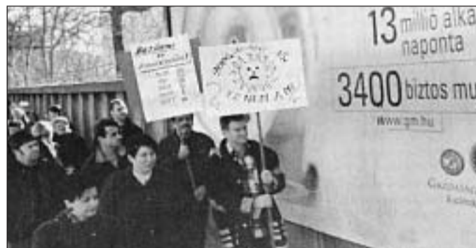
Konzervgyári tüntetés az elbocsátások miatt

– Milyen elképzeléseik vannak annak érdekében, hogy ne ügyiratokkal, hanem elsősorban a személyekkel foglalkozzanak?