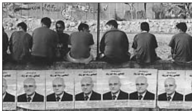
Palesztin fiatalok választási plakátok előtt

Január 28. A palesztin választásokon elsőprő győzelmet aratott a radikális Hamasz. Az eddig kormányzó Fatahnak mindössze 43 hely jut a 132 fős parlamentben. Az eredmény nemzetközi megítélése többnyire negatív: az USA, az ENSZ és az EU nyilatkozó illetékesei nem tárgyalnak a Hamasszal, amíg az nem mond le az erőszakról és Izrael megsemmisítéséről. A muszlim államokban viszont örömmel fogadták a Hamasz győzelmét.