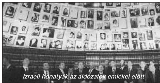
Izraeli honatyák az áldozatok emlékei előtt