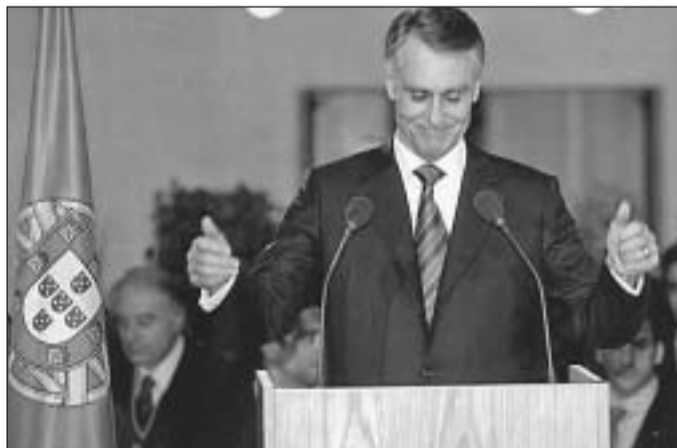
A győztes Cavaco Silva

A portugál alkotmány „gyenge” államfőt kreált, de az elnöknek joga van a törvények megvétőzésára és a parlament feloszlására is . Belpolitikai feszültség miatt a szocialista Jorge Sampaio 2004 decemberében előrehozott választásokat írt ki, amelyen megbukott Santana Lopes népszerűtlen jobboldali kormánya. Nem valószínű azonban, hogy a neoliberális gazdasági „reformok” iránti elkötelezettségben Socrates azonos álláspontot képviselő Cavaco Silva a közeljövőben revansot venne a szocialistákon.