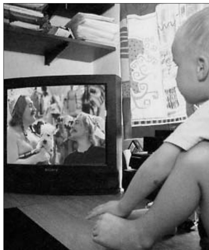
Milyen műsorokon nő fel a legifjabb nemzedék?