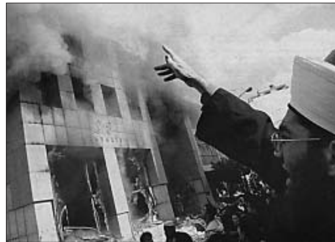
Felgyújtották a bejrúti dán konzulátust

Az európai kormányok hivatalos politikája a Közel-Kelet általános kérdéseiben is más, mint az amerikaiaké. Az USA