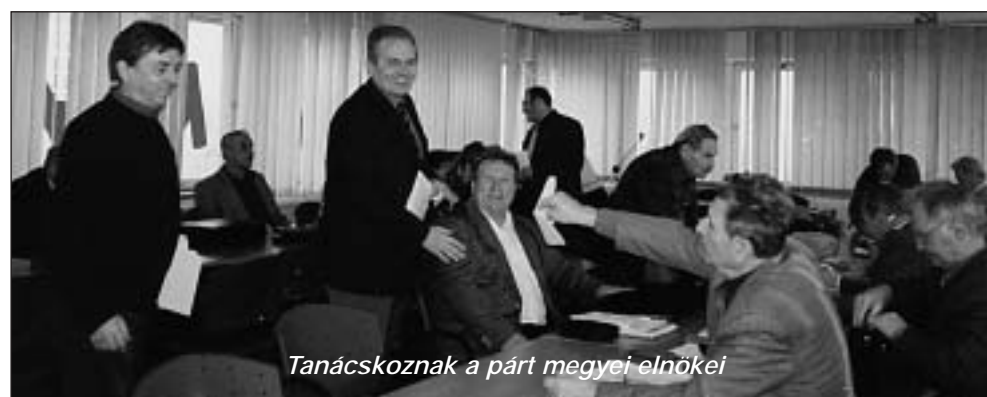
Tanácskoznak a párt megyei elnökei