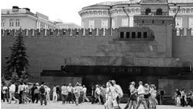
A Lenin Mauzóleum előtt

um díszőségét, Putyin nem meri bezárni, de engedi a bezárási kísérleteket. Az OFKP többszáz ezer aláírást gyűjtött már össze a mauzóleum védelmében, s a moszkvai kommunisták most a magyar kommunistákat is arra kérték, hogy gyűjtsünk mi is aláírásokat.