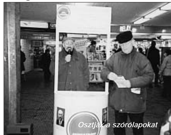
Osztják a szórólapokat