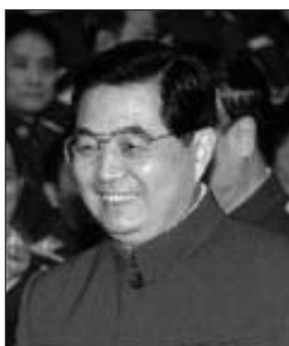
Hu Jintao, a Kínai KP főtitkára

A Kínai Kommunista Párt 1921-ben alakult Sanghajban. Az első kongresszus idején mintegy 50 tagja volt a pártnak, és 12 küldöttet delegáltak, köztük Mao Zedongot (Mao Cetungot), a párt későbbi legendás vezetőjét. 1928-ra a tag-