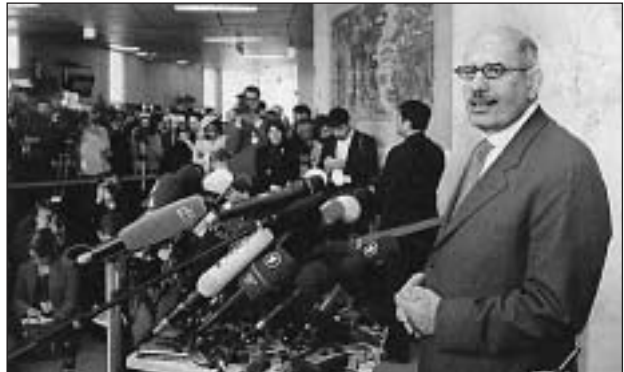
El-Baradei, a NAÜ főigazgatója

A NAÜ (Nemzetközi Atomenergia-ügynökség) főigazgatója reményt lát arra, hogy egy héten belül tárgyalásos megoldást találjanak az iráni atomprogrammal kapcsolatban. Ehhez azonban teljes beletekintési lehetőség kéri, illetve az urándúsítás teljes (kísérleti és ipari méretű) feladását. Kérdéses még, hogy a NAÜ a BT-hez fordul, vagy további haladékot ad Iránnak.