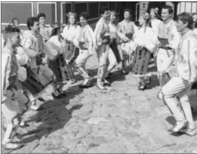
Őrzik a hagyományokat

követelményeket fogalmaz meg – sem a nagyromános közéleti szereplők, sem Markó Béláék nem tudtak teljes mértékben azonosulni. Utóbbiak azért nem, mert a magyarok érdekeit a román koalíciós partnerekkel egyetértésben