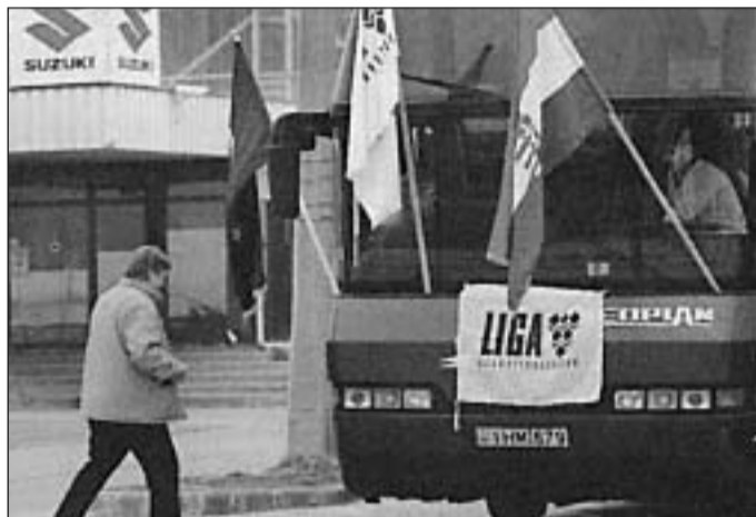
A szakszervezet egy buszban alakult meg januárban

Elmarasztalta a Suzuki cég esztergomi leányvállalatát a tatai munkáügyi bíróság: a napokban született döntés értelmében a multinacionális vállalat köteles lesz a jövőben engedélyezni a suzukis szakszervezet működését a gyár kapuin belül.