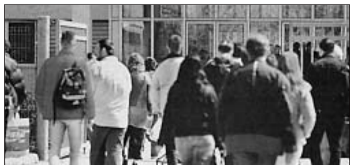
Érkeznek a délutánosok. Ők a két műszakos munkának is örülnek