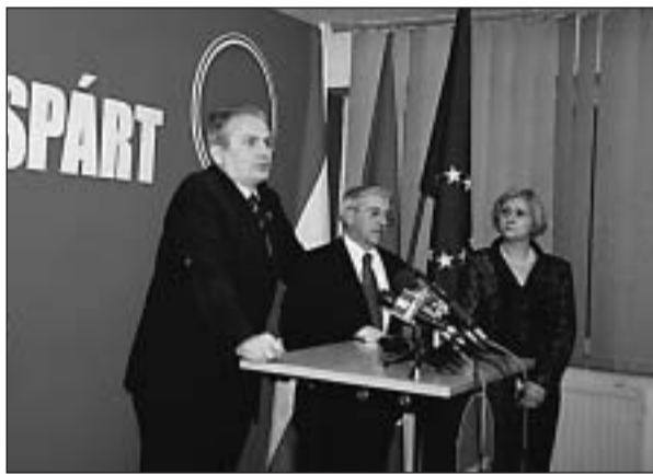
Nagy volt a sajtóérdeklődés a választás éjszakáján