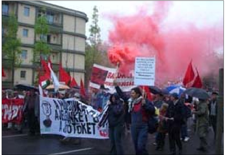
Vörös füst, harcos fiatalok, transzparensok és a felvezető teherautóról szóló munkásmozgalmi dalok lelkesítették a felvonulókat, a környéken sétálók hol tapsolva, hol kissé értetlenkedve figyelték a menetet

Sokan azt mondják: nem lesz párt, nem lesz Munkáspárt. Ellenfeleinknek üzenjük: ne orjúljenek! Bennünket nem lehet elsöpörni! Bennünket nem lehet megtörni! Bizonytalanok, kételkedő barátainknak üzenjük: amikor a legrosszabbal állunk, akkor tudtuk elérni a legjobb eredményeket. Akkor tudtuk pártunkból kihozni a legtöbbet. Így lesz ez most is!