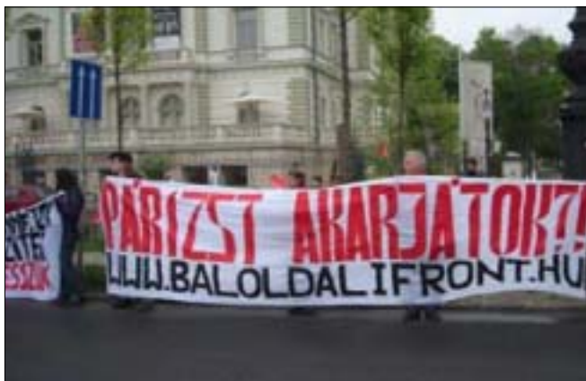
A május elsejei felvonulás szervezésében orosz-lánrészt vállaltak a Baloldali Front - Kommunista Ifjúsági Szövetség aktivistái