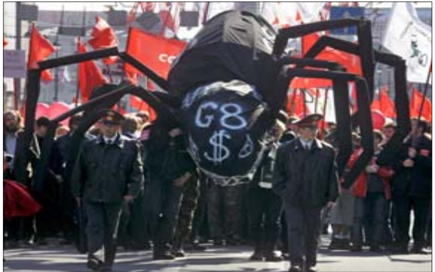
Kommunista és globalizáció-ellenes tüntetők egy, a világ iparilag legfejlettebb hét államát és Oroszországot tömörítő csoportot, a G8-at jelképező óriási pókot visznek egy felvonuláson Szentpéterváron 2006. május elsején. Ez év júliusában az észak-oroszországi város ad otthont a G8 csúcstalálkozónak.

Alekszandr Lukasenko új-raválásztásában. A belorusz elnök arcképe a