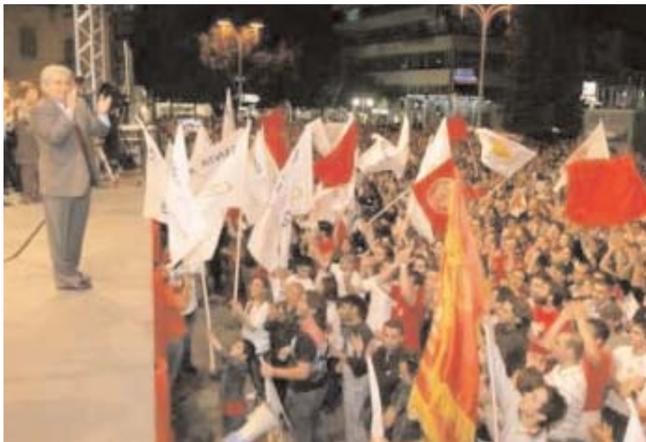
DEMETRIS CHRISTOFIAS, AZ AKEL FŐTITKÁRA A GYŐZTES VÁLASZTÁSOK ÉJSZAKÁJÁN AZ ÜNNEPLŐ PÁRTTAGOKKAL

Az ENSZ újraegyesítési tervét elutasító, jelenleg is hivatalban lévő kormánykoalíció győzött a május 21-én tartott ciprusi parlamenti választásokon. A hivatalos végeredmény szerint a kommunista Ciprusi Dolgozó Nép Haladó Pártja (AKEL) szerezte a legtöbb szavazatot 31,16 százalékkal, míg konzervatív riválisa, a Demokratikus Tömörülés (DISY) a voksok 30,33 százalékához jutott. Elég jól szerepelt Tasszosz