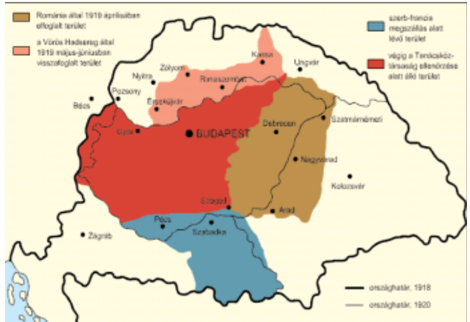
A TANÁCSKÖZTÁRSASÁG VÖRÖS HADSEREGÉNEK KATONAI SIKEREI

A Vörös Hadsereg 1919. május 10-én meghátrálásra kényszerítette a Salgótarján ellen támadó csehszlovák csapatokat, amelyek március 21-én Rimaszombatig vonultak vissza. A III. hadtest csapatai bevonultak a borsodi iparvidék központjába, visszaverték a május 23-án megindult csehszlovák ellentámadást, valamint megakadályozták a román hadsereg átkelési kísérletét a Hernád folyón. A Kormányzótanács elhatározta, hogy hadműveleteket indít amelyek célja: "először a cseheket megverni és azután a Tiszán átkelve, a román haderő ellen fordulni". A Vörös Hadsereg az Ipoly torkolatától a Sajó torkolatáig terjedő arcvonalon 73 zászlóaljjal és 46 úteggel rendelkezett. Ezzel az ellenségnek 90 zászlóalja és 32 útege állott szemben. A magyar haderő május 30-án lendült támadásba és június 6-án elfoglalta Kassát, majd június 10-én elérte galíciai határt. ■