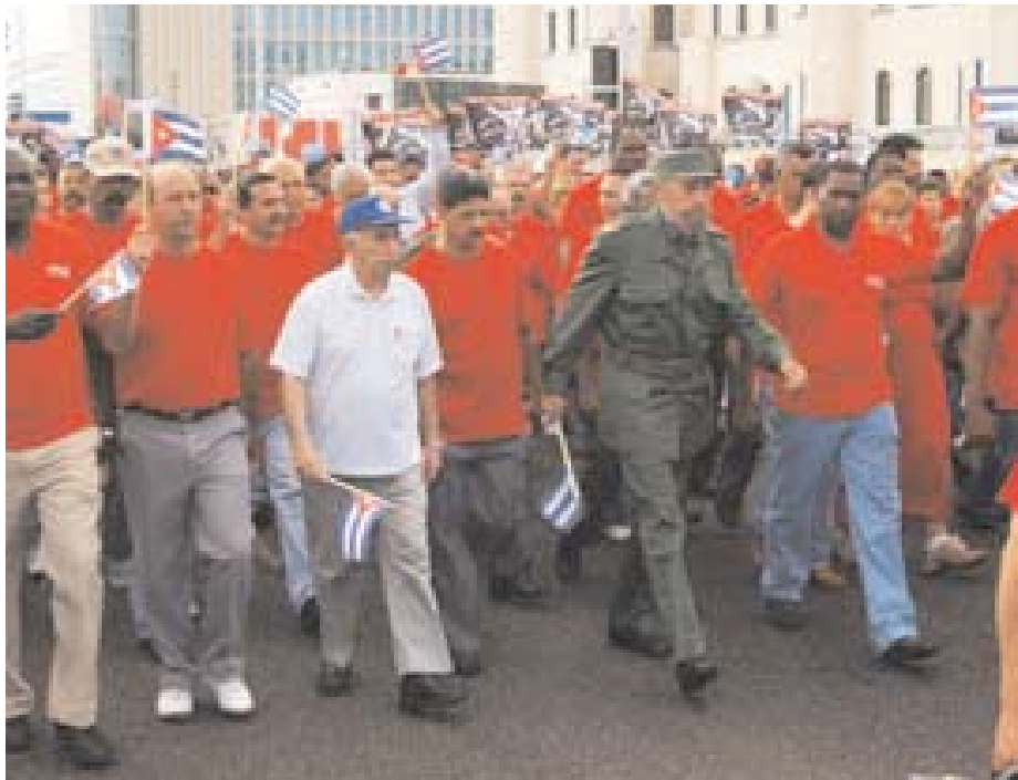
Fidel Castro 2006-ban Havannában, a hagyományos május elsejei felvonulás első sorában menetel

A 80 éves Fidel Castro kubai elnök felháborodottan utasította vissza az amerikai Forbes magazin állításait, miszerint 900 millió dolláros magánvagyonnal rendelkezne.