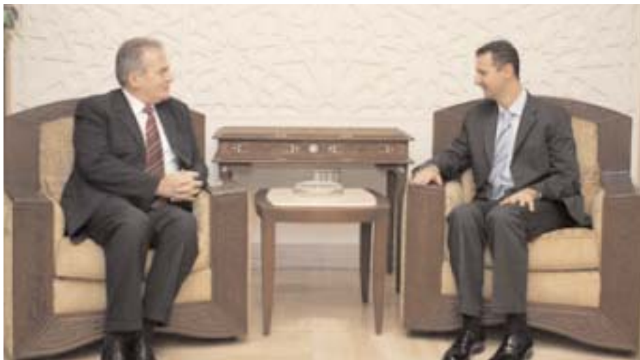
THÜRMER GYULA, A MAGYAR KOMMUNISTA MUNKÁSPÁRT ELNÖKE BASHAR ASSZAD SZÍRIAI ELNÖKNÉL DAMASZKUSZBAN

A Barátsággal Szíriáról kiállítás szervezői