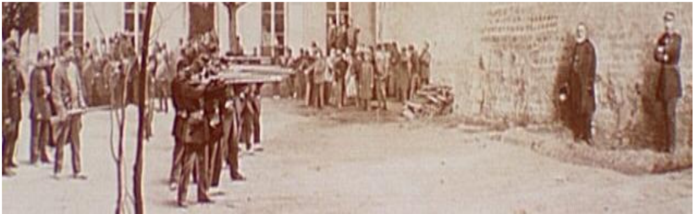
A KOMMÜNÁROK KIVÉGZÉSE A PERE LACHAISE TEMETŐ FALÁNÁL

A Versailles-i kormány (Adolphe Thiers miniszterelnök) csapatai elfoglalják Párizst, leverik a Párizsi Kommünt, az elfogott kommunárokat kivégzik