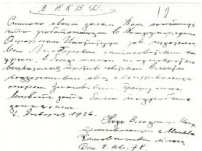
NAGY IMRE SAJÁTKEZŰ JELENTÉSE AZ OGPU-NAK, INNENTŐL HALÁLÁIG MÁR CSAK VOLOGYA, S Ő ÍGY IS VISELKEDIK

1930. szeptember 4-én írásbeli kötelezettséget vállalt az együttműködésre. Az OGPU rövid ideig használta ügynökként, majd 1930 végén a kapcsolat megszakadt.