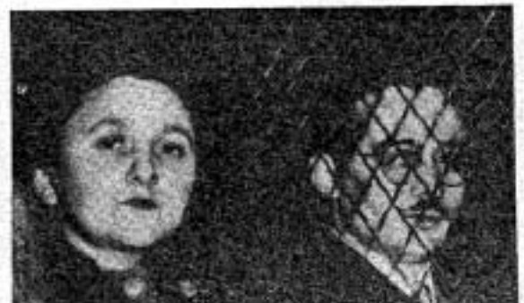
ETHEL AND JULIUS ROSENBERG Victims of a cold war Sacco-Vanzetti case?

A fasizálódó Amerikában, a McCarthy-korszokban, az atomtitokért halállal fizettek.