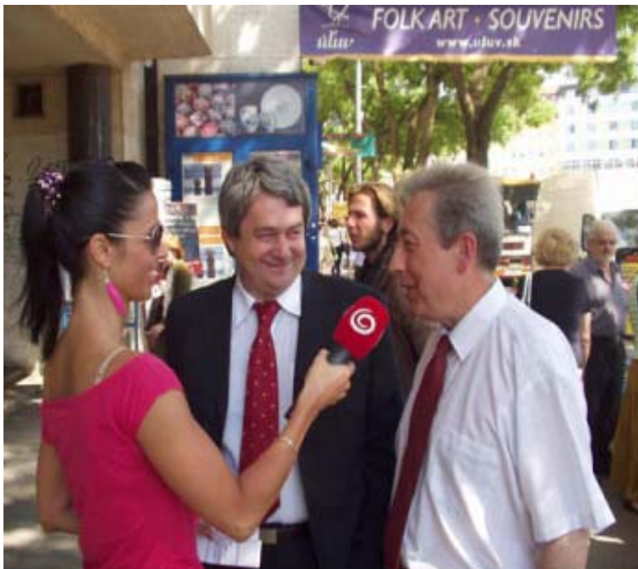
VOJŤI CH FILIP, CSEH- ÉS MORVAORSZÁG KOMMUNISTA PÁRTJÁNAK ELNÖKE (KÖZÉPEN) ÉS JOZEF SEVC, A SZLOVÁK KOMMUNISTA PÁRT ELSŐ EMBERÉVEL

Nagyon drukoltunk a szlovák kommunistáknak, hogy őrizzék meg parlamenti helyeiket. Sajnos, nem sikerült. 3, 88 százalékot ért el, ami kevesebb, mint az 5 százalékos küszöb. 2002-ben a kommunista sikernek két oka volt. Az akkori szlovák szocialisták végletesen meggyengültek, és szavazóik közül sokan a kommunistákra szavaztak. Ehhez kellett az is, hogy a Szlovák KP tagjai végigjárják az egész országot. Az elmúlt négyben azonban jelentős változások történtek. A kommunisták most is sokat dolgoztak, de ellenfeleik megkísérelték megvásárolni a kommunista képviselők egy részét, és a vezetésben is megjelent egy - a kapitalizmussal megalkuvó - szárny. A Szlovák KP leküzdötte a betegséget, de mindez nem múlt el nyomtalanul. Az idei