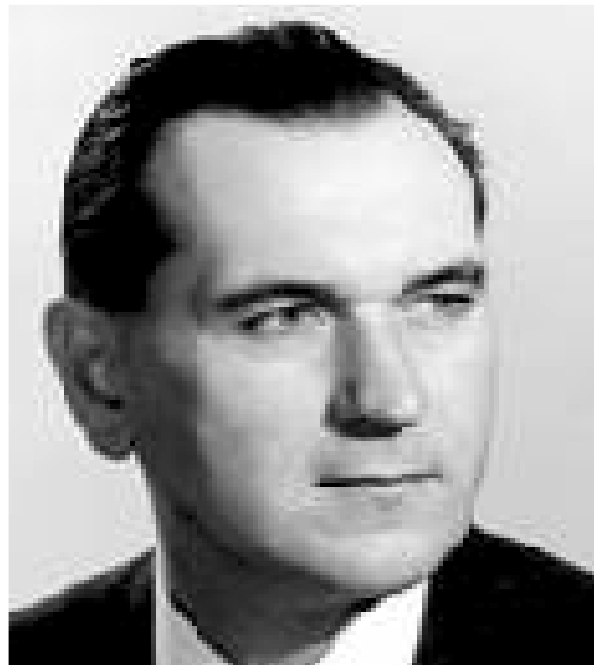
GRÓSZ KÁROLY KITÜNŐ DIAGNÓZIST ADOTT A MAGYAR SZOCIALIZMUSRÓL, DE A GYÓGYMÓDOT CSAK TALÁLGATTA. A NAGY IMRE-ÜGYBEN IS CSAK ÚSZOTT AZ ESEMÉNYEKSEL

A féligazságok sorát gyarapítja, hogy Nagy Imre felszabadulás előtti tevékenységéről viszonylag kevés pontos ismerettel rendelkezünk. Szeretném emlékeztetni önöket, hogy az MSZMP és az SZKP együttműködést kezdett a szovjetunióbeli magyar emigrációval kapcsolatos dokumentumok feltárára. Ez év [1989] márciusában a főtitkári megbeszélésen megállapodás született arról is, hogy a két párt együttműködik a magyar-szovjet viszony történetével, az 1956-os eseményekkel kapcsolatos dokumentumok feltárássában és tanulmányozásában is.