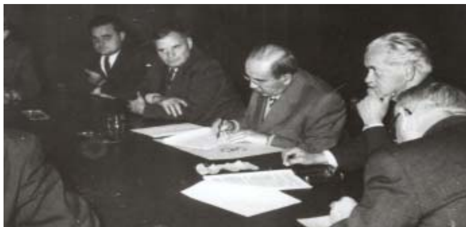
A NAGY IMRE KORMÁNY TAGJAINAK FOGALMA SEM VOLT ARRÓL, KICSODA A MINISZTERELNÖK