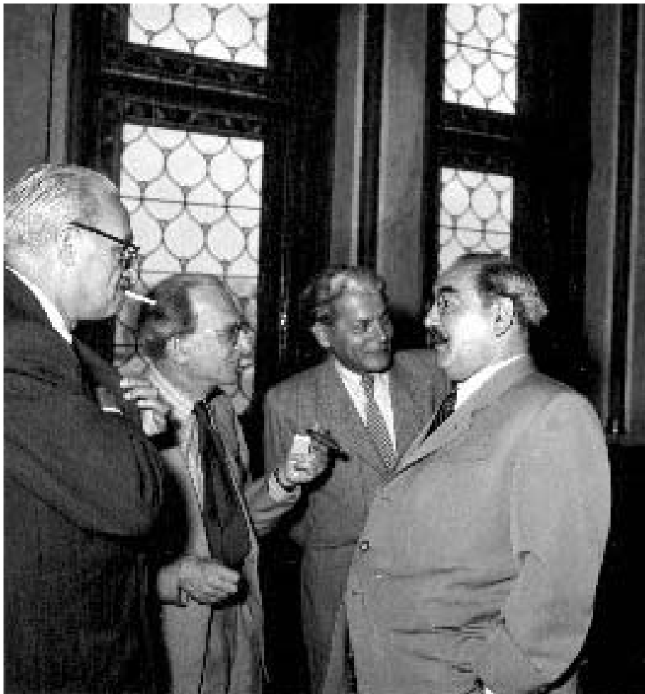
PARLAMENTI FOLYOSÓ, 1954 JÚNIUSA. LUKÁCS GYÖRGY (BALRÓL A MÁSODIK) NAGY IMRÉVEL BESZÉLGET. LUKÁCS VALÓSZÍNŰLEG HALÁLÁIG NEM TUDTA, KI ÁRULTA EL

Három: A dokumentumok alapján az is megállapítható, hogy Nagy Imre jelentései alapján több magyar, német és más nemzetiségű kommunistát ítéltek el "szovjetellenes, terrorista, ellenforradalmi, trockista" tevékenységért.