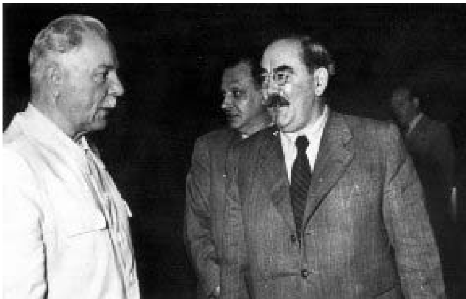
A SZÖVETSÉGESEKET 1945-BEN MAGYARORSÁGON KÉPVISELŐ KLIM VOROŠILOV MARSAL TUDTA KI IGAZÁBÓL NAGY IMRE. NAGY IMRE IS TUDTA, HOGY TUDJÁK