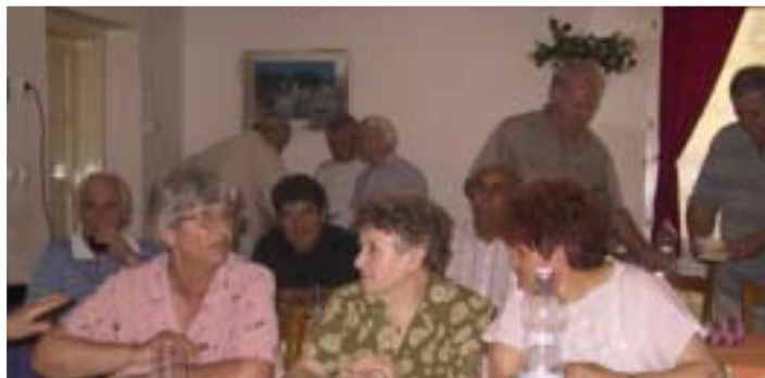
PILLANATKÉP A MEGYEI ÉRTEKEZLET ÜLÉSÉRŐL

A Magyar Kommunista Munkáspárt központjának fenntartására indított "Ezer párttag" mozgalomhoz a múlt hétig huszonötven csatlakoztak Baranyából, ami a taglétszám arányát tekintve a legjobb eredmény az országban. ■