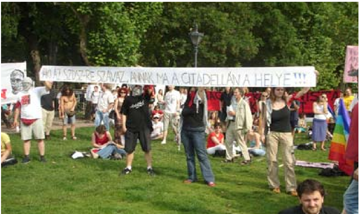
A BALOLDALI FRONT - KOMMUNISTA IFJÚSÁGI SZÖVETSÉG AKTIVISTÁI TILTAKOZNAK TAMÁS GÁSPÁR MIKLÓS FELSZÓLALÁSA ELLEN. A MAGÁT RADIKÁLIS BALOLDALINAK NEVEZŐ POLITOLÓGUS AZ IDEI PARLAMENTI VÁLASZTÁSOKON "A LIBERALIZMUS UTOLSÓ BÁSTYÁJÁNAK" SZÁMÍTÓ SZABAD DEMOKRATÁK SZÖVETSÉGÉNEK TÁMOGATÁSÁRA SZÓLÍTOTT FEL. TGM KORÁBBI PÁRTTÁRSAI, A BUSHT MEGHÍVÓ POLITIKUSOK A CITAPELLÁN ÜNNEPELTÉK A VILÁG TÚLNYOMÓ, TISZTESSÉGES TÖBBSÉGE ÁLTAL TERRORISTÁNAK TARTOTT AMERIKAI ELNÖKÖT. A FELIRAT A BALOLDALI FRONT TRANSPARENSÉN: "AKI AZ SZDSZ-RE SZAVAZ, ANNAK MA A CITAPELLÁN A HELYE!!!"

Vessenek véget a Kuba elleni blokádnak. A magyar kormányok ebben a kérdésben se támogassák az USA agresszív politikáját!