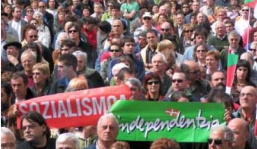
TÜNTETÉS BASZKFÖLDÖN. FELIRAT A TRANSPARENSEKEN: SZOCIALIZMUS ÉS FÜGGETLENSÉG

Június végén tartották a 3. Nemzetközi Baszkföldi Napokat (SOKOA III). A Batasuna - baszk párt - rendezvényén idén a magyar Baloldali Front is részt vett.