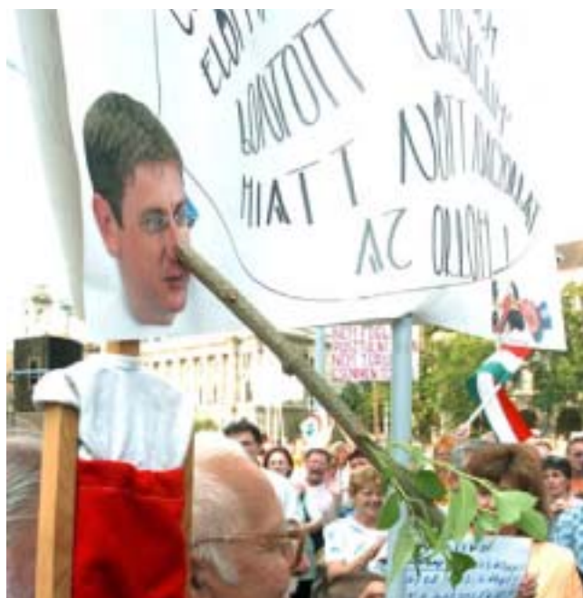
A MUNKÁSPÁRT TAGJAI A KÖZPONTI BIZOTTSÁG DÖNTÉSE ÉRTELMEBEN RÉSZTVEVTEK A CIVIL SZERVEZETEK HÉT ELEJI PARLAMENT ELŐTTI TÜNTETÉSÉN

A Munkáspárt támogatja a szakszervezetek tüntetését