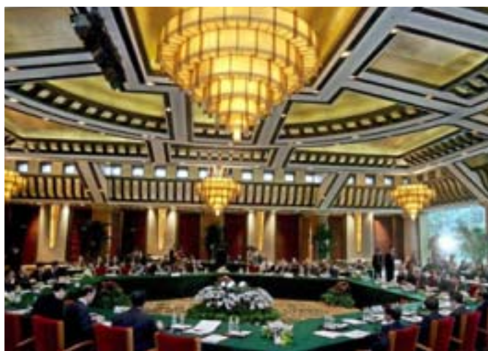
A HATOLDALÚ TÁRGYALÁSOK

Az amerikaiak félelme nem is emiatt van. Nem félnek ők a KNDK-tól. Az amerikai rakétavédelem nyilván képes a koreai rakéták elhárítására. Sőt, az USA - ahogyan ez Koszovóban is történt - képes nagy pontosságú csapásokat mérni akár KNDK-beli célpontokra. Buszt az zavarja, hogy vannak országok, amelyek kilógnak a