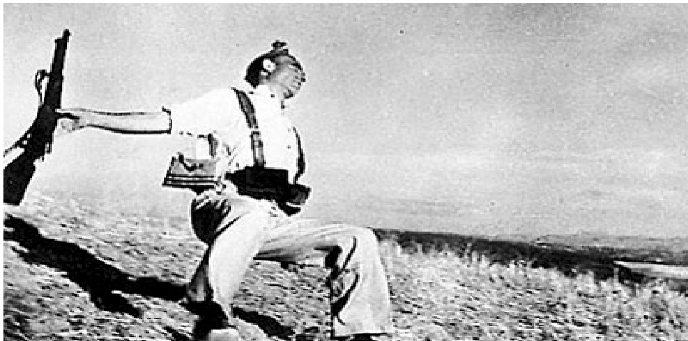
AZ EGÉSZ VILÁGOT BEJÁRT LEGENDÁS KÉP A KÖZTÁRSASÁGI KATONA HALÁLÁRÓL

A spanyol polgárháború 1936-tól 1939-ig tartó, egész Spanyolországra kiterjedő fegyveres konfliktus volt. A spanyol köztársaság 1931-es megalakítása után az ország lakossága két részre szakadt. Az egyik oldalon a köztársaság támogatói álltak: a polgári köztársaságiak, a szo-