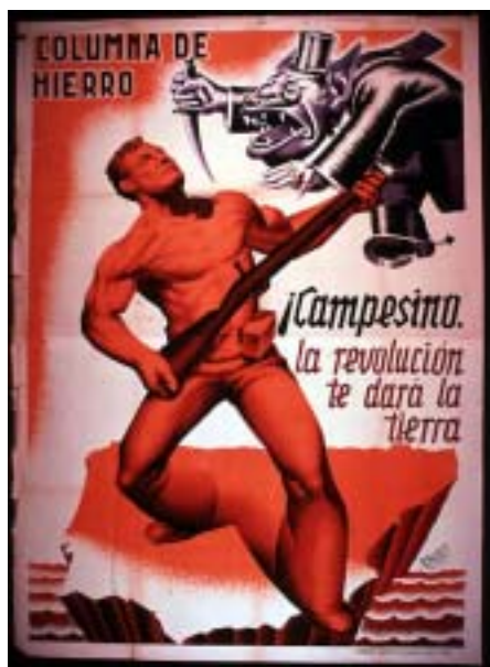
SPANYOL POLGÁRHÁBORÚS PLAKÁT

A polgárháború alatt a harctereken 70 ezren estek el, 30 ezer embert gyilkoltak meg, illetve végeztek ki, és 15 ezren estek a légitámadások áldozatául.