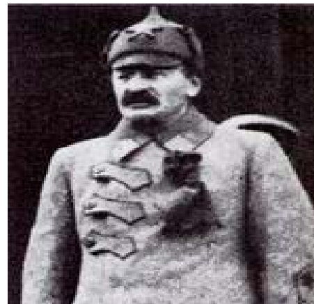
TROCKIJ A VÖRÖS HADSEREG UNIFORMISÁBAN

világforradalmi fellendülés elmúltával egyre nehezebben képviselhető, egyre absztraktabb lett. 1928 januárjában a GPU határozatára száműzték az Oroszországi SzSzSzK területéről. Ezután Alma-Atában élt 1929-ig. Januárban a GPU Trockijt „szovjetellenes tevékenység” miatt a Szovjetunió elhagyására kötelezte. Száműzetésében is folytatta a „bolsevik-leninista” ellenzék szervezését, ennek legfontosab eszköze a Bjuljetyeny Oppozíció című folyóirat volt. Ebben a „sztálini frakciók” elleni harcra, a „bürokratikus degenerálódás” elleni fellépésre buzdított. Kezdetben csak bírálta a Komintern politikáját, de 1938-tól kísérletet tett egy IV. Internacionálé létrehozására. Eközben már lezajlottak a nagy moszkvai perek, ahol Trockij távollétében is főszereplő volt: minden ellenzéki csoportosulás vezéréként őt vizionálták. Végül 1940. augusztus 20-án egy Ramón Mercader nevű, valószínűleg NKVD-ügynök otthonában jégcsákánnyal agyonverte. Mexikóban temették el. ■