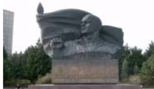
A BERLINI ERNST THÄLMANN EMLÉKMŰ

A Gestapo 1933. március 3-án letartóztatta, ennek ellenére március 5-én parlamenti képviselőnek választották. Mandátumát érvénytelenítették, bebörtönözték. Kiszabadításáért hatalmas nemzetközi akció folyt. A fasiszták 1944. augusztus 18-ára virradó éjjel titokban a buchenwaldi koncentrációs táborba vitték és ott agyonlőtték.