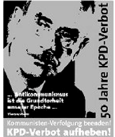
A KONFERENCIA PLAKÁTJA