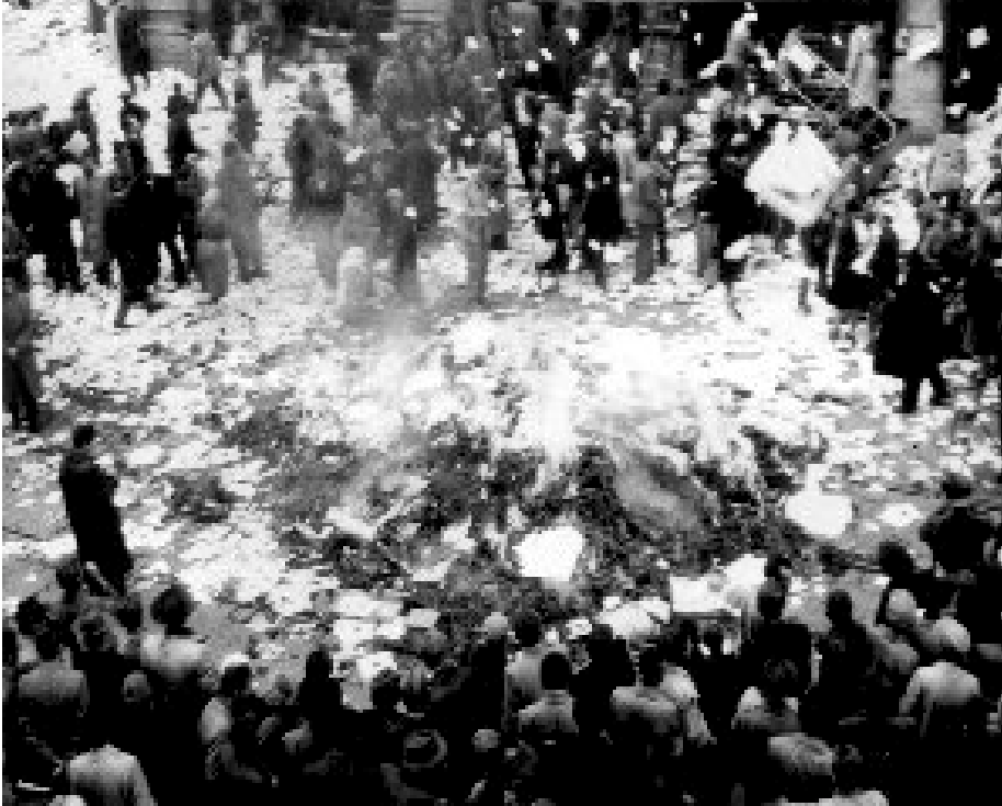
KÖNYVÉGETÉS A HORIZONT MOZI ELŐTT 1956-BAN - ÉPPÚGY, MINT A NÁCI NÉMETORSZÁGBAN

1956 mozgalmas napjaiban természetesen nem születhettek ideológiai természetű tanulmányok, még kevésbé nagyobb terjedelmű monográfiák. Erre egyrészt az ellenforradalom leverését követő évtizedekben került sor, illetve - jobboldali szellemben - a polgári rendszerváltás után. Ezúttal arra vállalkozom, hogy a korabeli sajtóban tallózva "mazsolázzam" ki az ideológiai elemeket. Nem könnyű feladatról van szó, mert a különböző irányzatú lapok legtöbbször álcázva fejtették ki gondolataikat, óvakodva az önlepleződéstől. A tömegbefolyás megszerzése, illetve kiszélesítése során ügyelniük kellett ugyanis arra, hogy tekintettel legyenek az elmúlt tíz esztendő nevelésének, propagandájának hatására.