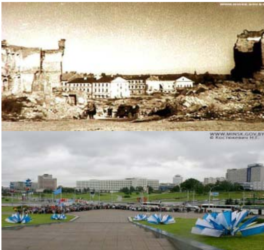
MINSZK 1944-BEN ÉS MA. BELORUSSZIA A HÁBORÚBAN TALÁN A LEGNAGYOBB ÁLDOZATOT HOZTA A SZOVJETUNIO KÖZTÁRSASÁGAI KÖZÜL.