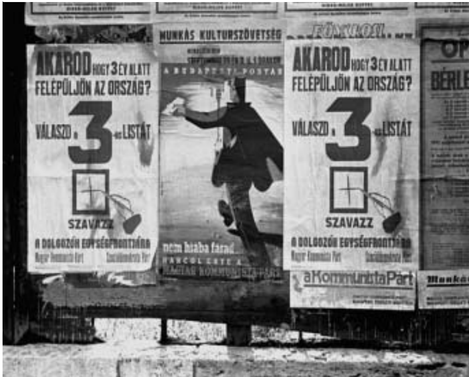
A MAGYAR KOMMUNISTA PÁRT VÁLASZTÁSI PLAKÁTJA 1945. OKTÓBER 6-ÁN

1946-ban, a sikeres pénzügyi stabilizáció után (augusztus 1.) a koalíció jobboldala, összefogva a koalíción kívüli reakcióval támadást indított a kibontakozó népi demokratikus forradalom ellen. Az volt a nem titkolt célja, hogy megakadályozza a népi erők hatalmának megszilárdítását, s a polgári jobboldal számára biztosítsa a hatalom megszerzését. A szociáldemokraták körében meghasonlást okozott a harc kiéleződése. Peyerek ellene voltak a néphatalom létrejöttének és a visszahúzó erők szövetségét ke-