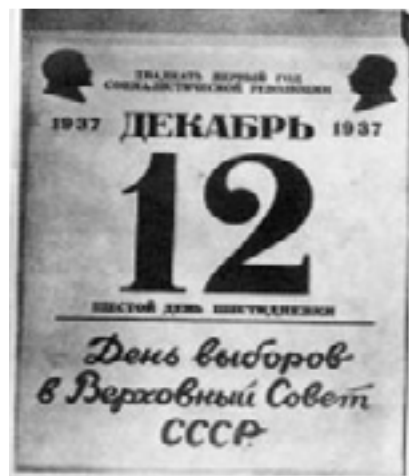
1937. ÉVI SZOVJET FORRADALMI NAP-TÁR EGY LAPJA

A hét napjait hétről ötre csökkentették. A pihenőnap meghatározásához a dolgozókat öt csoportra osztották, és mindegyik csoporthoz egy szint rendeltek (sárga, rózsaszín, vörös, mályva, zöld). Mindegyik csoport a hét más-más napján vehette ki a pihenőt. A szándék az volt, hogy létrehozzák a „megszakítás nélküli termelési hetet”, elkerüljék a pihenőnapok miatti leállásokat, és ezzel javítsák az ipar hatékonyságát. Noha e rendszerben a dolgozóknak több pihenőnap jutott (minden hetedik nap helyett ötnaponként), a csoportba sorolás megnehezítette a családi és szociális életet, emiatt rendkívül népszerűtlenné vált. Ráadásul a várt gazdasági növekedést sem hozta meg. Mivel a helyzet robbanásveszélyessé vált, a „naptárreformot” felfüggesztették: 1931. december 1-től visszaállították a Gergely-naptár hónapjainak eredeti hosszát. A hetek hatnaposak lettek, a pihenőnapok pedig mindenki számára a hónap 6., 12., 18., 24. és 30. napjaira estek. A 31 napos hónapok utolsó napja továbbra sem tartozott a hetekhez, és lehetett mind munkanap, mind pedig pihenőnap. Végül 1940. június 26-án visszaállították a hétnapos heteket, ezzel gyakorlatilag megszűnt a szovjet forradalmi naptár.