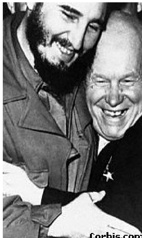
FIDEL CASTRO ÉS NYIKITA HRUSCSOV TALÁLKOZÓJA

Hruscsov jelentős szerepet játszott a magyar történelemben is. 1956-ban Kádár Jánossal szemben München Ferenc megválasztását támogatta, s Tito jugoszláv vezető határozott erőltetésére állt Kádár mellé, s segítette szovjet csapatokkal az ellenforradalom leverését.