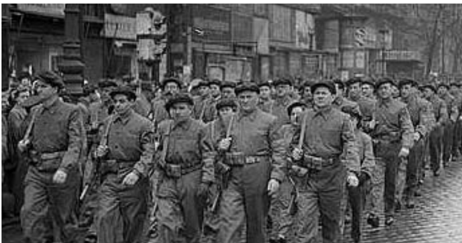
MUNKÁSÖRÖK FELVONULÁSA 1957 MÁRCIUSÁBAN BUDAPESTEN

A Munkás-Paraszthatalomért Érdemérem az 1956 utáni szocialista rendszer leg-szimbolikusabb kitüntetése. Világosan kifejezte a kormány, a rendszer osztály-tartalmát. A hatalom a munkásoké, a parasztké volt. A kitüntetés egyszerre volt a szocialista rend kifejezése, amit a vörös csillag jelképezett, és magyar is, amit mutatott a nemzeti színű szalagsáv.