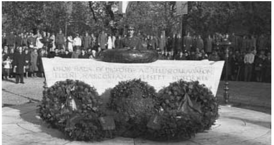
ILYEN VOLT 1986. OKTÓBER 30-ÁN....

"LAPUNK KÉRDÉSÉRE VÁLASZOLVA VÁLLALTA SZEREPÉT A VOLT MINISZTERELNÖK. BOROSS PÉTER ELMONDTA, HOGY AZ 56-OS SZERVEZETEK RÉGI KÉRÉSE VOLT, HOGY A KOMMUNIZMUST DICSSŐÍTŐ FELÍRAT "NE TÜNDÖKÖLJÖN" AZ EMLÉKMŰVÖN. SŐT, A VETERÁNOK LEGSZÍVESEBBEN A KOMMUNISTÁK SÍRHELYEIT IS FELSZÁMOLTATTÁK VOLNA. VÉGÜL KOMPROMISSZUM SZÜLETETT: A PROVOKÁLÓ FELÍRATOT LEMESZELTETTÉK, A SÍRHELYEK VISZONT MEGMARADTAK. " A MUNKÁSPÁRT A JÖVŐ HÉTEN TILTAKOZÓ LEVELET INTÉZ AZ ÜGYBEN ÉRINTETT VEZETŐKHOZ.