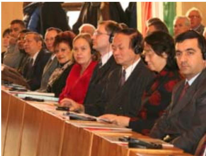
A KÜLFÖLDI VENDÉGEK A MUNKÁSPÁRT KONGRESSZUSÁN AZ ELSŐ SORBAN

Magyar Kommunista Munkáspárt 22. kongresszusa