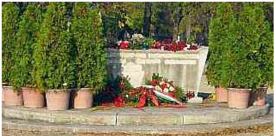
ÉS ILYEN LETT 2006-RA....