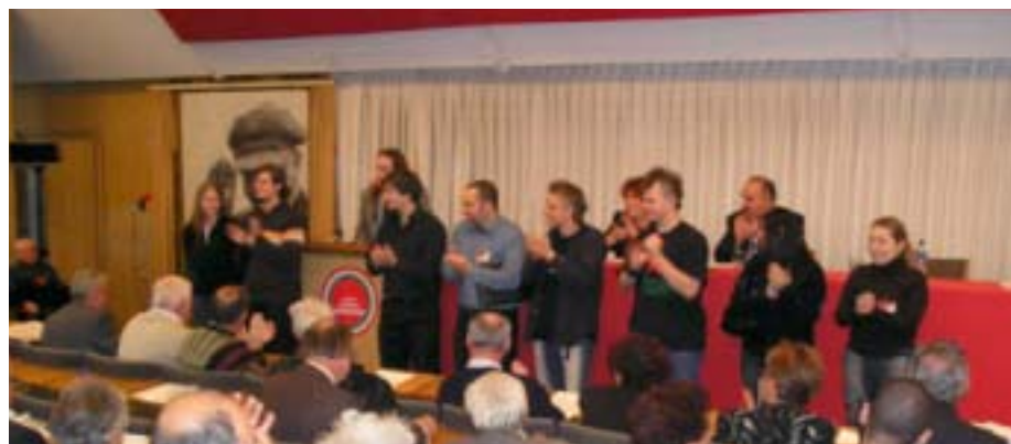
A BALOLDALI FRONT - KOMMUNISTA IFJÚSÁGI SZÖVETSÉG ÚJ VEZETŐSÉGE BEMUTATKOZIK A MUNKÁSPÁRT KONGRESSZUSA ELŐTT