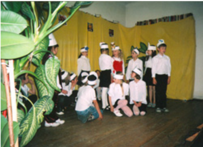
AZ ARANY JÁNOS ÁLTALÁNOS ISKOLA TANULÓINAK ELŐADÁSA

János Általános Iskola alsós növendékeit vártuk. Nagy volt az izgalom, hiszen a sok nagymama teli szívvvel, maga sütötte finomságokkal is készült a