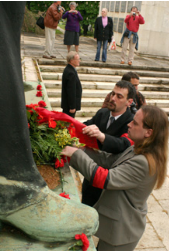
A MUNKÁSPÁRT ELNÖKSÉGE MEGKOSZORÚZTA A MEGYALÁZOTT MUNKÁSMOZGALMI PANTEONT IS