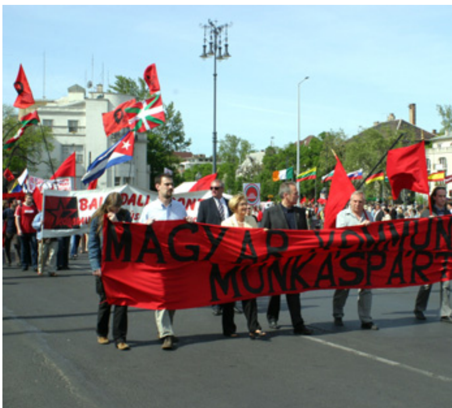
A FELVONULÁSI MENET ÉLÉN A PÁRT ELNÖKSÉGE ÉS A BALOLDALI FRONT

3 „A baloldalon mi vagyunk az egyetlen párt. A szocialista párt vezetői jó állásokért eladták baloldaliságuk maradékát is. Gyurcsány megtagadta Kádár Jánost. Megtagadta mindazt, amiért szüleink és nagyszüleink dolgoztak. A szocialisták szíve a jobb oldalon dobog.