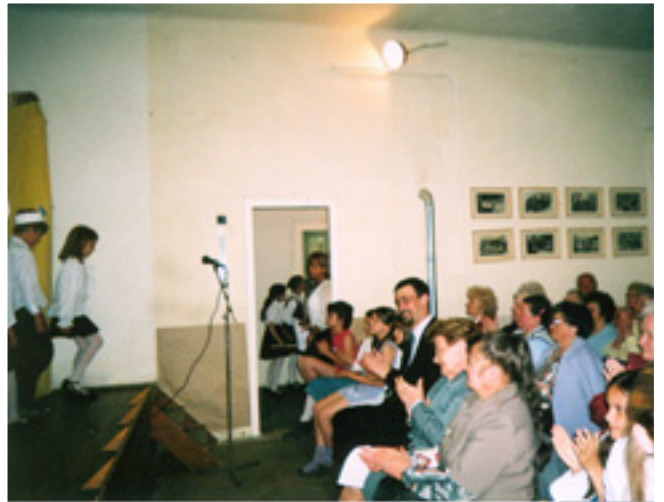
NAGY TAPSOT KAPTA AZ ANYUKÁKTÓL, A NAGYMAMÁKTÓL