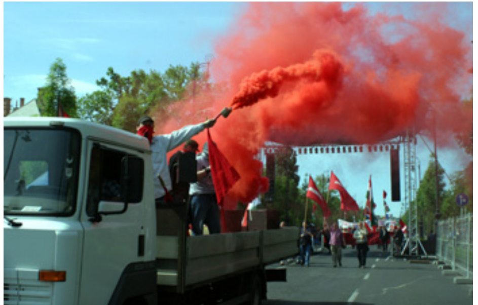
A FIATALOK VÖRÖS FÜSTTEL BORÍTOTTÁK BE A FELVONULÁS ÚTVONALÁT. A HŐSÖK TÉRI KORMÁNYÜNNEPSÉG RÉSZTVEŐI KÖZT NAGY FELTÜNÉST KELTETT A MUNKÁSPÁRT MAJÁLISOZÓ MENETE

Egész nap élénk volt a forgalom a párt politikai sátrainál, ahol a párt elnöke dedikálta Balszemmel című kötetét, fogytak most is a régi kiadású