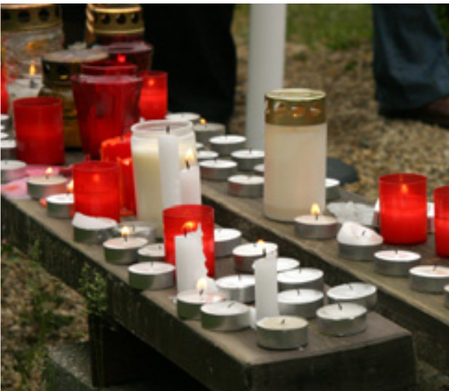
TÖBB SZÁZ GYERTYÁT GYÚJTOTTAK KÁDÁR JÁNOS SÍRJÁNÁL

május 5., szombat - a Munkáspárt illetékesei számára kora reggel a helyszínen kiderül, hogy 7 órára titokban, a nyilvánosság teljes mellőzésével visszahantolták Kádár János megmaradt földi maradványait, s visszaállították a síremléket. A Munkáspárt Elnöksége az embertelen és tisztességtelen eljárásról tiltakozó nyilatkozatot tesz közzé. A Munkáspárt 10 órai kezdettel tartott gyűlésén beszédet mond Thürmer Gyula.