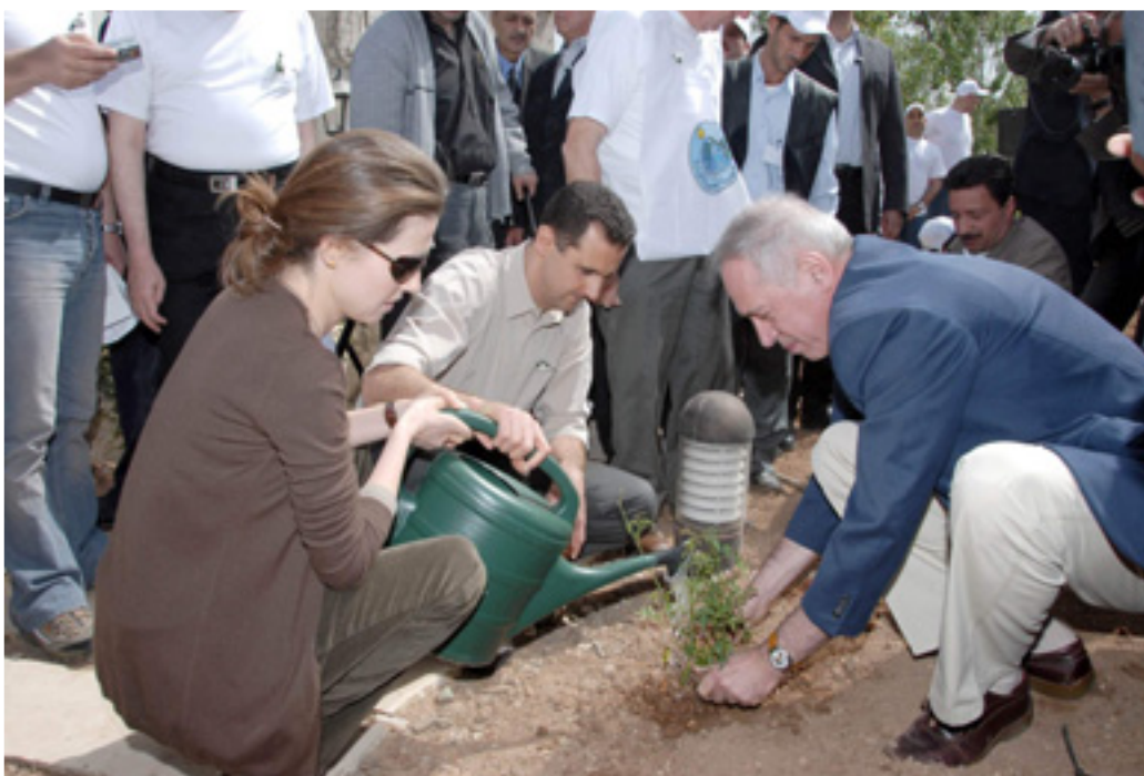
BASHAR AL-ASSAD ELNÖK ÉS FELESÉGE FÁT ÜLTETNEK A VÁLASZTÁSOK NAPJÁN

Április 22-én parlamenti választások voltak Szíriában. A Nemzeti Haladó Frontban tömörült szervezetek kapták meg a szavazatok többségét. A frontban 10 párt vesz részt, köztük a Baath Arab Szocialista Párt és a kommunisták is. A 250 fős parlamentben a front mos 172 helyet szerzett, öttel többet, mint négy éve. A választásokon a választópolgárok 56 százaléka vett részt.