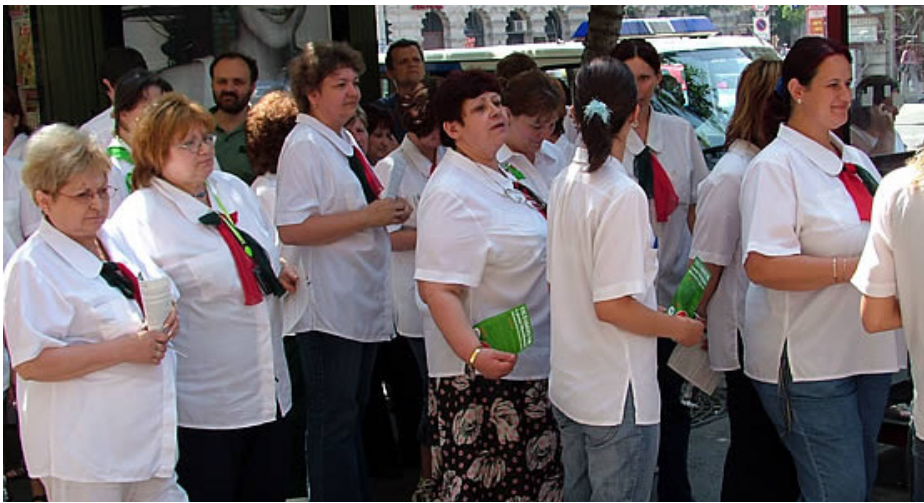
A POSTAI DOLGOZÓK DEMONSTRÁCIÓJA A NYUGATI TÉRI POSTAHIVATAL ELŐTT

2007. június 6-ára európai akciónapot hirdetett az UNI Europa Posta, az európai postászakszervezeteket tömörítő, mintegy kétmillió tagot számláló szervezet.