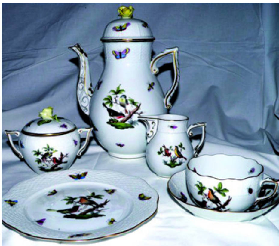
A HERENDI PORCELÁNGYÁR TERMÉKEI - KI TUDJA MÉG MEDDIG FOLYIK A TERMELÉS...