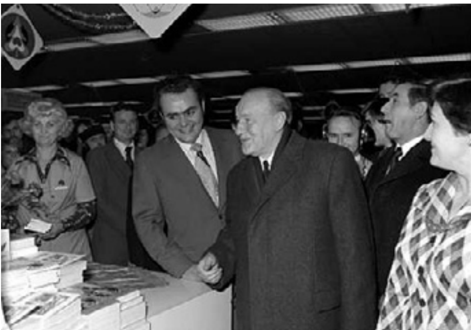
KÁDÁR JÁNOS LÁTOGATÁSA BUDAPESTEN - 1976

Politizálni szigorúan tilos volt. Kérdezni is csak Kádár kérdezhetett, de ő is csak a családról, a partnerek egészségéről. És persze, mint minden rendes kártyapartiban, mindenki elmondhatta a véleményét a többiek ultitudásáról. Szinte tobzódásnak számított a néhány pohár kőbányai sör és zsiroskenyér vöröshagymával, amit sehol másutt nem engedhetett meg magának az ország első embere, csak nálunk, Kőbányán.