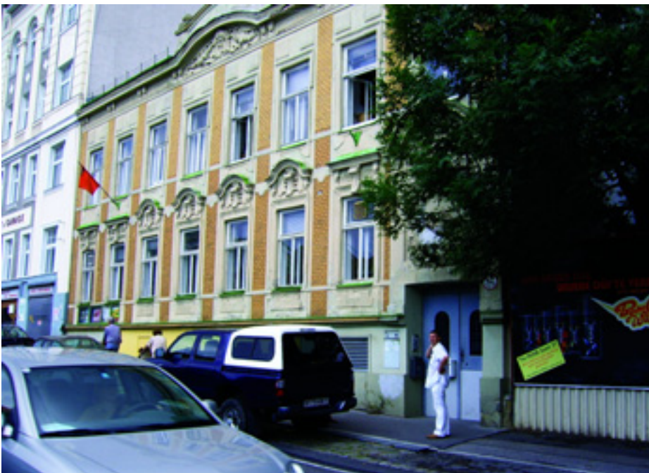
AZ OSZTRÁK KOMMUNISTA PÁRT ÚJ ÉPÜLETE