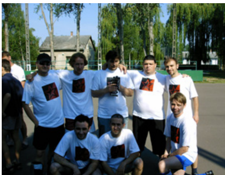
IDÉN MÁSODSZORRA ÁLLÍTOTT CSAPATOT A BALOLDALI FRONT - KOMMUNISTA IFJÚSÁGI SZÖVETSÉG

SOKAN MÁR VOLTAK ORSZÁGGYŰLÉSI JELÖLTEK, DE ÚJ FIATALT IS SIKERÜLT TALÁLNIUK.