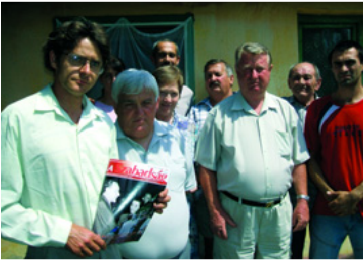
EGYKOR KOMMUNISTA SZOMBAT - MA KOMMUNISTA VASÁRNAP. A NAGYKÖRÖSI TANÁCSKOZÁS RÉSZTVEVŐI

Csak azok tanulhatnak, akik meg tudják fizetni az oktatást. 2007-ben a tandíjfizetést azok a kormányzati emberek sürgetik, akik a Kádár-rendszerben ingyen tanulhattak. Mit gondol a baloldalinak színezett kormányokról a Tesco-pénztáros vagy az üzemből kirúgott dolgozó, akinek a háztartásában 50 százalékkal emelték meg a gáz árát és vizetdíjas nyugtáért kényszerül sorban állni? Egyebek közt ezek a kérdések is szóba kerültek Nagykőrösön, a Magyar Kommunista Munkáspárt vasárnapi összejövetelén.