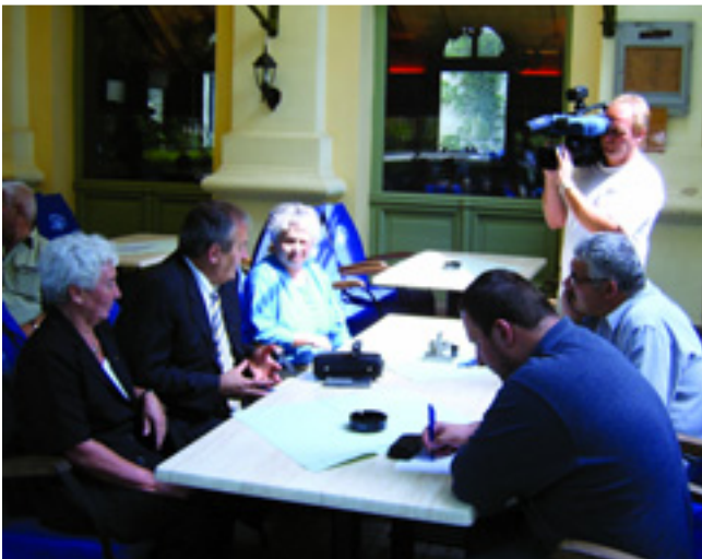
SAJTÓTÁJÉKOZTATÓ KECSKEMÉT BELVÁROSÁBAN