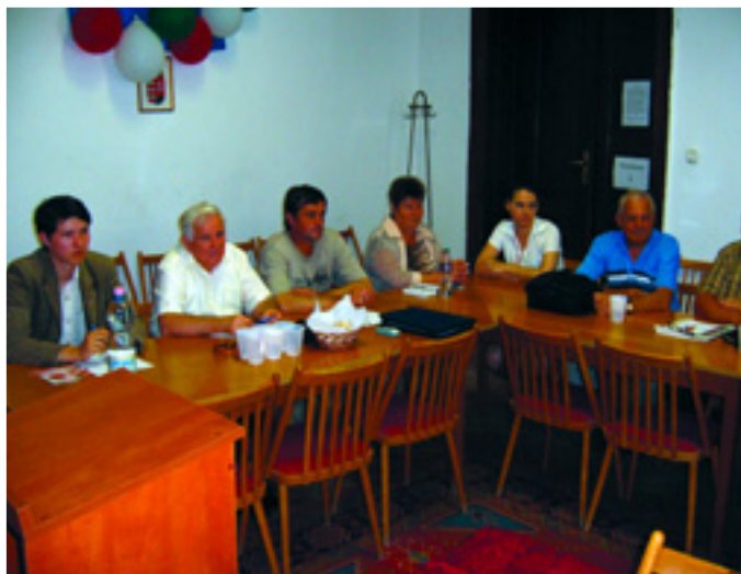
TALÁLKOZÓ DEBRECENI AKTIVISTÁKKAL

Az 1900-as évek elejétől ehhez a körzethez kötődik egész családja. Születése óta szinte mindennapos vendég volt a Fényes udvarban.