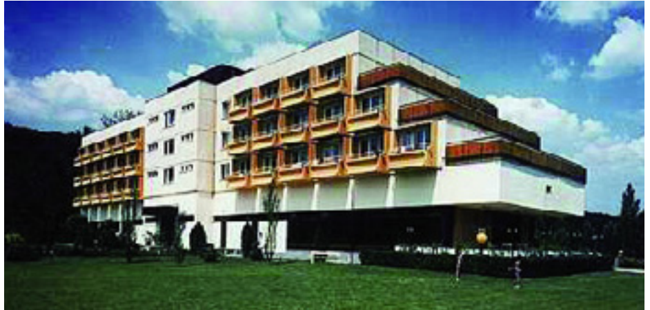
AZ EGYKORI BALATONALIGAI PÁRTÜDÜLŐ

1963 decemberében kerültem a balatonaligai MSZMP-üdülőbe dolgozni, mint fizikai munkás. Több területen is dolgoztam, mindig ott, ahol éppen szükség volt rám. Többször találkoztam Kádár elvtárral. Kádár János