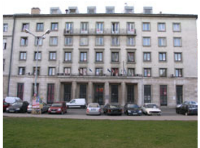
A KÖZTÁRSASÁG TÉRI PÁRTHÁZ

Messzemenően támogatom az efféle, az egek magasából lerángatott, ködfoszlányokkal egyenlő érveket, annál is inkább, mivel tudom: a szóvivő úr még szülői álommal sem érett, amikor a II. világháborús 1945 januári harcok elültével abban az akkor Tisza Kálmán (ma Köztársaság) téri épületben leverte sátorfáját az a nemzedék, amely a budapesti kommunisták magját alkotta. Nyilván ez, továbbá a későbbi fejlemények, leginkább az 1956. október 30-ai vérontás emléke csiklandozza az MSZP jelenlegi prominenseinek az orrát. Prüszkölnek, mint mindenkor, ha "a múltat be kell