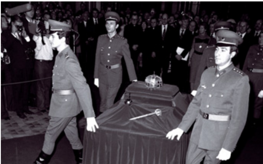
KORMÁNYŐRÖK A KORONA VISSZAADÁSAKOR