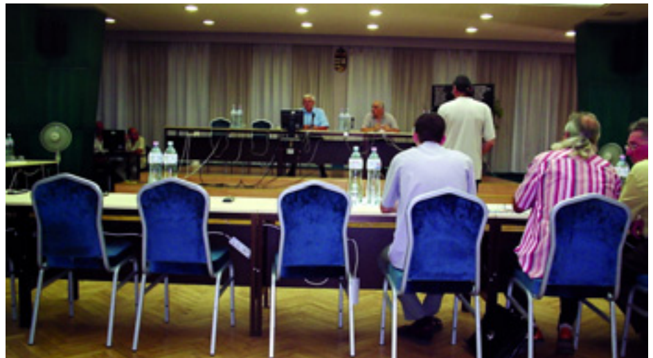
CSEPELI ÖNKORMÁNYZATI ÜLÉS - SZOCIALISTA KÉPVISELŐK NÉLKÜL

Téma pedig van bőven. "Wellness-központot vártak a csepeliek a zöldellő Királyerdő Kis-Duna parti részére, de száznyolevan lakásos lakóparkot kapnak helyette, 18 méter magas épületekkel. A helyi polgárok úgy érzik, évekig tudatosan megvezették őket." -írta