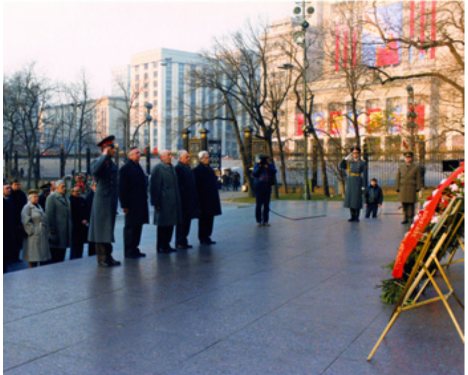
MAGYAR PÁRT- ÉS ÁLLAMI VEZETŐK EGYKORI KOSZORÚZÁSA

Kádár János nem volt ivós ember. Voltaképpen mindent megivott, de mindent igen mértékletesen. A magyar ember borhoz szokott, a sör városi ital volt - mondta el nem egyszer, visszagondolva fiatal korára. A sör a legjobb altató, de egyben ébresztő is - mondta sokszor viccesen, amikor egy-egy külföldi úton esténként megivott egy pohár sört. Ha vendégeket fogadott, eleinte konyakkal kínálta őket. Később áttért a whiskyre, ami akkoriban még különleges italnak számított