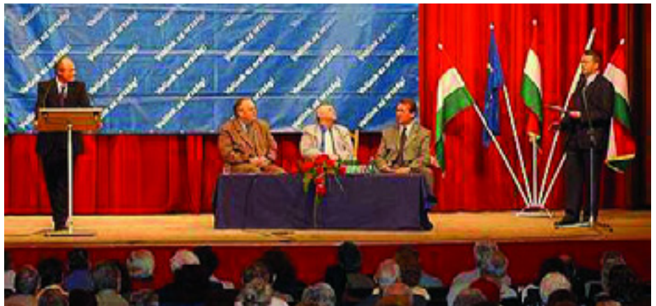
MEDGYESSY PÉTER BESZÉL A CSEPELI MUNKÁSOTTHONBAN, AZ ÜLŐ SORBAN AVARKESZI DEZSŐ, MSZP-S KÉPVISELŐ, TÓTH MIHÁLY, CSEPEL POLGÁRMESTERE, PODOLÁK GYÖRGY KÉPVISELŐ

2. Budapest XXI. kerület Csepel Önkormányzata Képviselő-testülete úgy dönt, hogy a Csepel SC központi telephelyén, a 201861/1 és a 201861/2