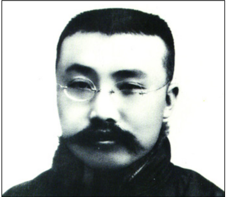
LI DAZSHAO, KORÁNAK LEGISMERTEBB MARXISTÁJA

azt, hogy a kommunisták részt vehetnek-e egy polgári párt tevékenységében, beléphetnek-e Kuomintangba, vagy sem. Itt nem arról volt szó, amit minden marxista párt szervezeti szabályzata tilt, vagyis a párhuzamos tagságról. A kérdés sokkal inkább az volt, amire Lenin utalt, amikor biztatta a kommunistákat, hogy a párt tudatos döntése alapján vegyenek részt a jobboldali szakszervezetekben. A kérdés annál is inkább jogos volt, hiszen ebben az időben a kommunisták létszáma 420 fő volt, a kongresszuson 30 delegátus volt. Cheng Duxiu, a párt vezetője elmondta, hogy ugyan következőket proletárpárt a kínai kommunisták pártja, de a valóságban még nem ők irányítják a munkásságot. A parasztságról már nem is beszélve, akik között a kommunisták nem is voltak jelen. Kétféle álláspont csapott össze. Az egyik szerint a kommunisták soha semmilyen jobboldali szervezetbe nem léphetnek be.