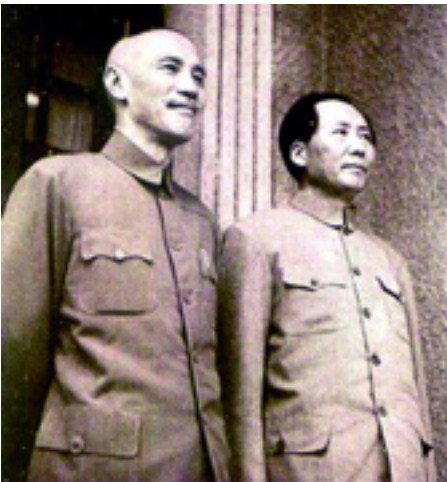
CHIANG KAI-SHEK, A KUOMINTANG ÉS MAO ZEDONG, A KÍNAI KP VEZETŐJE

A 3. kongresszusnak egy ma is nagyon időszerű kérdést kellett eldöntenie. Nevezetesen