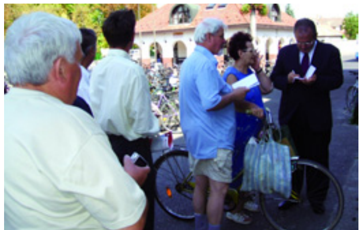
KÉT KÉP A BALSZEMMEL ÁRUSÍTÁSÁRÓL: NAGYKÖRÖSÖN, A BUSZPÁLYAUDVAR MELLÉ ÁLLT KI A MUNKÁSPÁRT ELNÖKE, HOGY DEDIKÁLJA A KÖNYVET. SOKAN MEGÁLLTAK, ALÁÍRATTÁK A KÖNYVET, VETTEK A SZABADSÁG ÚJSÁGBÓL IS