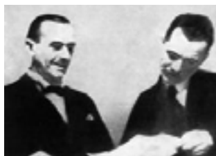
THOMAS MANN ÉS JÓZSEF ATTILA BUDAPESTEN