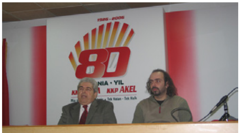
DIMITRIS CHRISTOFIAS, AZ AKEL FŐTITKÁRA ÉS ANDREAS ADERNEAU, AZ EDON KÜLÜGYI FELELŐSE

A találkozó résztvevői maradéktalan hálájukat nyilvánították ki az EDON felé, hogy az megszervezte ezt a szemináriumot lehetőséget adva ezzel, hogy a résztvevők építsék kapcsolataikat és tapasztalatokat cseréljenek a kapitalista globalizáció és az "Új Világrend" elleni harcról. (A Szabadság következő számában ismertetjük a szemináriumon elfogadott zárónyilatkozatot). ■