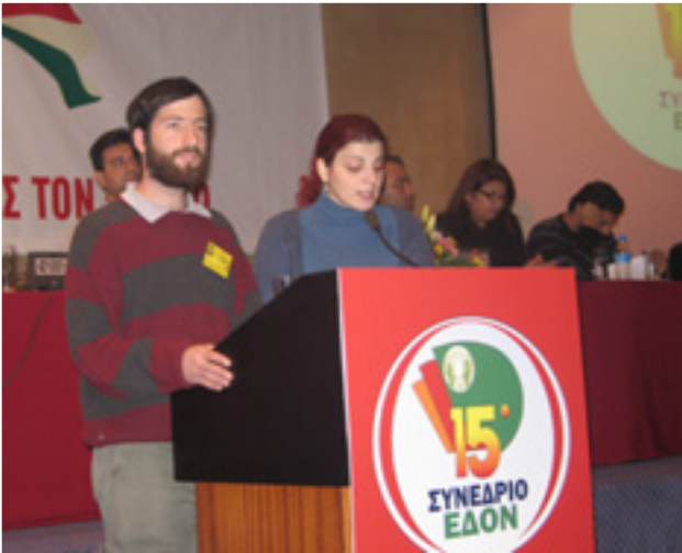
AZ EDON KONGRESSZUSÁNAK MEGNYITÁSA

Elmondta, hogy az AKEL négy miniszterrel (belügy, külügy, egészségügy, közlekedésügy) van jelen a kormányban, valamint a nemrégiben lezajlott helyhatósági választásokon az összes nagyobb városban, köztük a fővárosban Nicosiában megszerezték a polgármesteri székeket. Hangsúlyozta, hogy ez sajnos nem azt jelenti, hogy Cipruson szocializmus lenne, de a párt ereje mindenképpen elég arra, hogy megvédje a szigetországot a kapitalista globalizáció főbb káros hatásaitól.