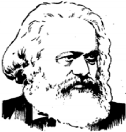
LENIN - A MARXIZMUS FOLYTATÁSA A 20. SZÁZADBAN

"A Munkáspárt marxista-leninista, kommunista párt." - olvashatjuk a Munkáspárt szervezeti szabályzatában. A marxizmus alapjait Marx (1818-1883) és Engels (1820-1895) fogalmazta meg még a 19. században. Vlagyimir Iljics Lenin (1870-1924) egy más világban, Oroszországban született, és egy másik korban. Amikor Lenin megjelent a politikában, a tőke már mindenütt győzött Európában. Mindenütt létrejöttek a nemzeti államok. Ekkor kezdődött meg a világ újrafelosztása és vele együtt a nagy világháborúk kora. Lenin megérhette a marxi eszmék győzelmét is. Lenin neve összeforrott az 1917-es Nagy Októberi Szocialista Forradalom győzelmes kivívásával, a Szovjetunió létrehozásával. Lenin a marxizmus módszerét alkalmazta a 20. század viszonyaira és tovább is fejlesztette.