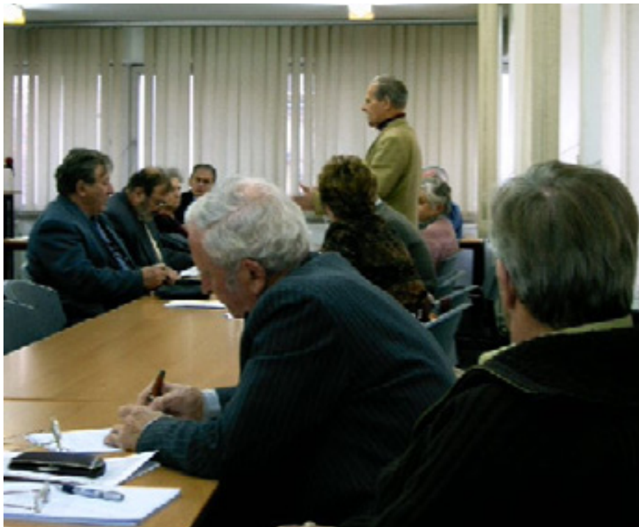
ÜLÉSEZIK A MUNKÁSPÁRT MEGYEI ELNÖKI ÉRTEKEZLETE

2007. JANUÁR 8-ÁN ÜLÉSEZETT A MUNKÁSPÁRT MEGYEI ELNÖKI ÉRTEKEZLETE. ITT SOK FONTOS NAPIREND MELLETT A PÁRT LAPJÁNAK, A SZABADSÁG ÚJSÁG ÚJRAINDÍTÁSÁNAK ÉS ÚJ TÍPUSÚ TERJESZTÉSÉNEK KÉRDÉSÉT TÁRGYALTÁK MEG.