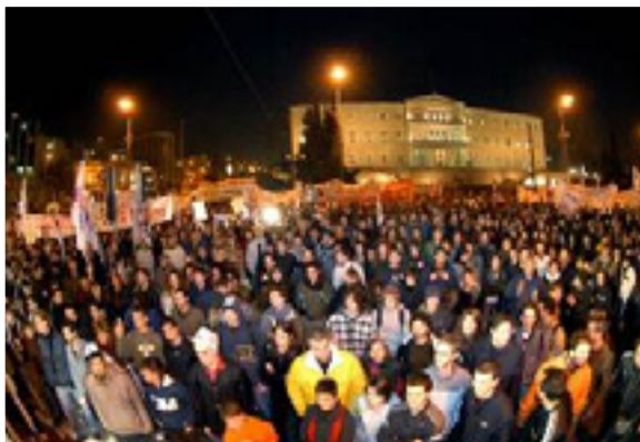
GÖRÖG FIATALOK DEMONSTRÁLNAK AZ OKTATÁS PRIVATIZÁCIÓJA ELLEN

Az egyetemi és középiskolai diákok visszamentek az utcákra. A fiatalok nagy tömegei elfoglalták az egyetemeket és a középiskolákat és ugyanazon a napon kétszer demonstráltak több, mint 6 órán keresztül. A tüntetések január 10-én voltak több, mint 40