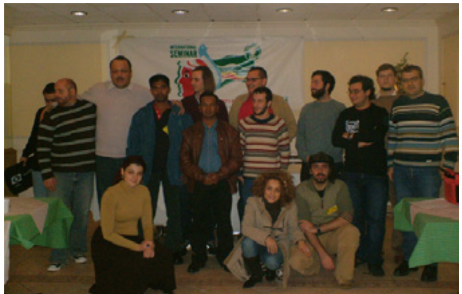
A NEMZETKÖZI SZEMINÁRIUMON RÉSZTVEVŐK CSOPORTKÉPE - 13 KOMMUNISTA IFJÚSÁGI SZERVEZET DELEGÁLTJAI

A szeminárium közben a résztvevőknek lehetőségük nyílt találkozni a ciprusi politikai élet egyes szereplőivel is. Az AKEL oktatásügyi felelőse (az EDON egykori elnöke) előadást tartott a haladó szemléletű oktatásügyi reformról, amely gyermekközpontúan fogja átfogóan átalakítani a teljes ciprusi oktatásügyi rendszert, az óvodáktól a felsőoktatásig. Az AKEL főtitkára, Dimitris Christofias aki a ciprusi parlament házelnöke, pedig általánosan ismertette a párt helyzetét és politikáját.