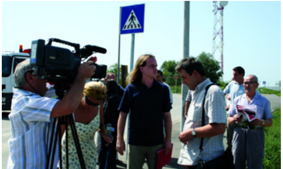
NAGY VOLT A SAJTÓ ÉRDEKLŐDÉSE. ŐK SEM ÉRTETTÉK MIÉRT ZÁRTÁK EL A MUNKÁSOKAT

Ilyenek például: a tűzoltók, rendőrök, katasztrófa-védelmisek, az egészségügyben, közlekedésben, erőművekben, stb. dolgozók.