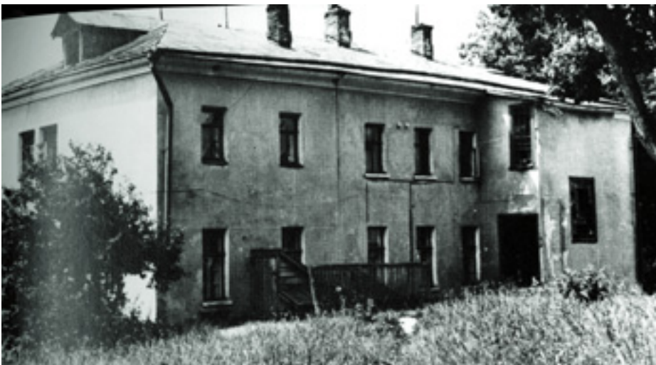
A MOSZKVAI HÁZ, AHOL A KÍNAI KOMMUNISTÁK 6. KONGRESSZUSUKAT TARTOTTÁK

A Kuomintang 1931-ben a KB 14 tagját, benne a főtitkárt is elfogta és kivégeztette. ■