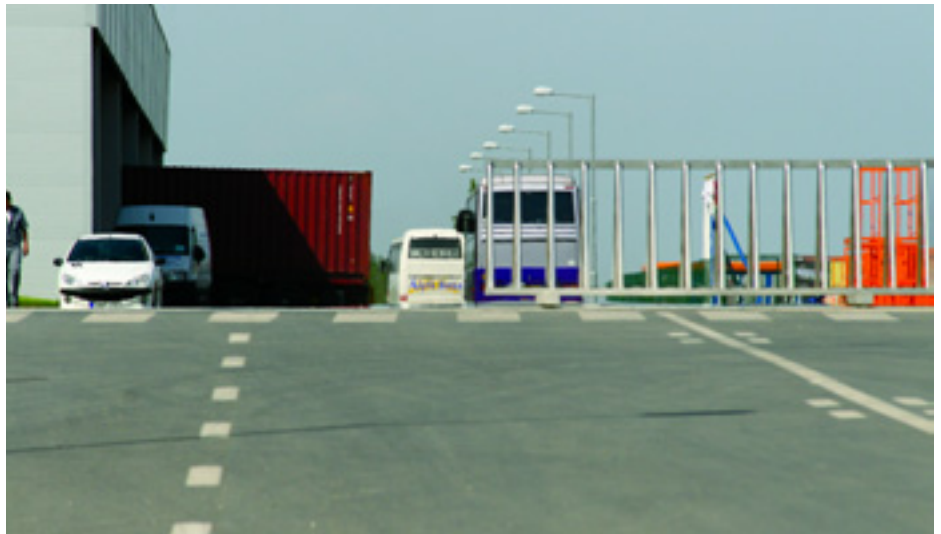
A KORDONOK MÖGÉ ELZÁRT MUNKÁSOK, MUNKÁSBUSZOK

A Munkáspárt szakszervezeti munkacsoportja a közeljövőben a munkásszállásokon is meg fogja keresni a dolgozókat. ■