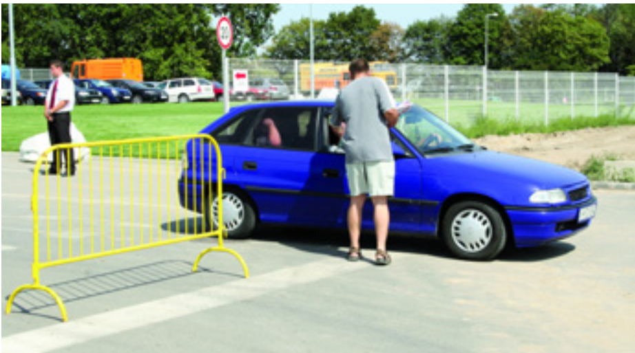
CSAK A GÉPKOCSIK JÖHETTEK KI A KAPUN

Levélben fordulunk továbbá a VDSZ munkajogászához, melyben kérjük, a munkások érdekvédelmének előremozdítása érdekében biztassa a dolgozókat, hogy munkaügyi bíróságon szerezzenek érvényt a jogaiknak.