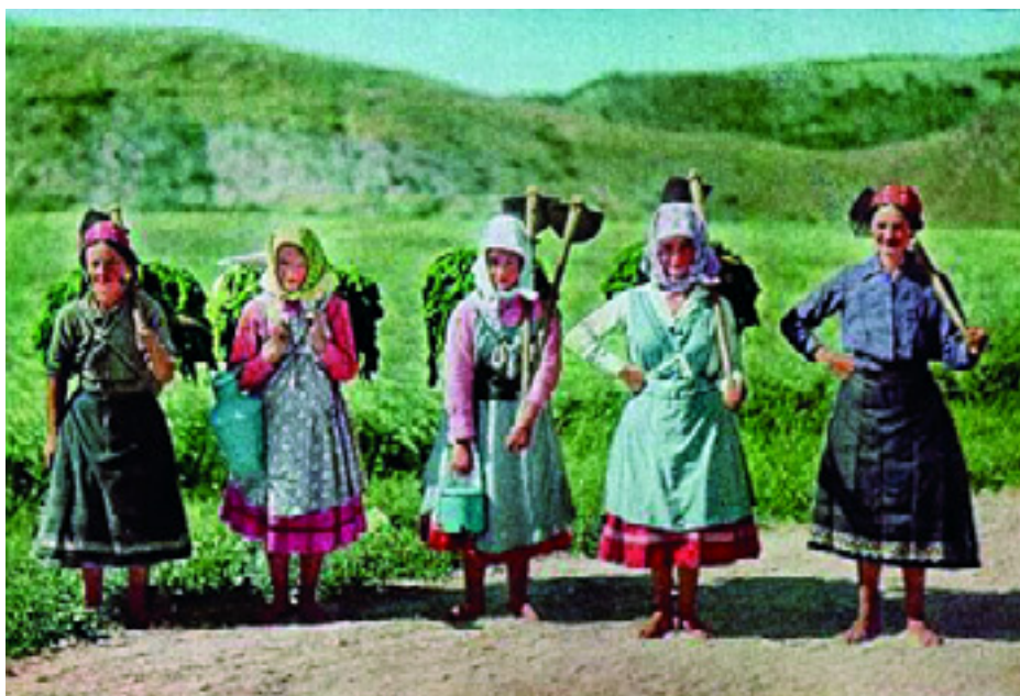
URADALMI CSELÉDEK A '30-AS ÉVEK MAGYARORSZÁGÁN

Ez vajon miért nem tűnik fel a hatóságoknak?! A válasz egyszerű: a tulajnak jók az "összeköttetései".