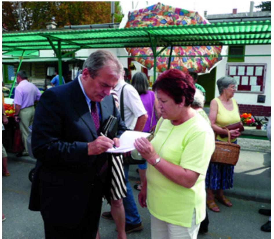
BALSZEMMEL CÍMŰ KÖNYV DEDIKÁLÁSA A BAJAI PIACON

Ma már nincs háború, a külföldi tőke mégsem nagyon jön, mert nincs út. Ráadásul nem is szerepel a kormányzati tervekben, hogy Felső-Bácskát autópályával kötnék össze a fővárossal. Ez sem lenne elviselhetetlen gond, állapították meg mindketten, ha a magyar kormány támogatná a térség kis- és középvállal-