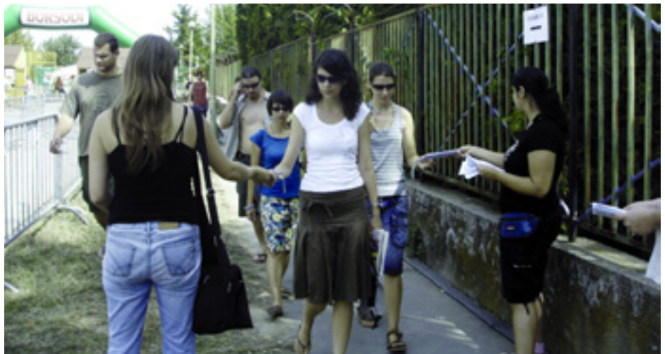
A BALOLDALI FRONT AKTIVISTÁI A DISZKRIMINÁCIÓ ELLENI TILTAKOZÓ SZÓRÓLAPOT OSZTOGATJÁK A SZEGEDI IFJÚSÁGI NAPOK FŐBEJÁRATÁNÁL

A szervezők „túlpolitizálással“ sem vádolhatták a Munkáspárt ifjúsági szervezetét.