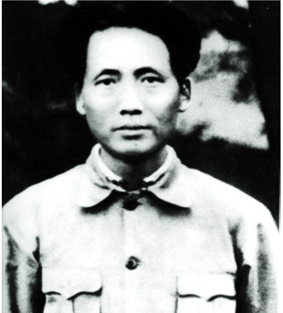
MAO ZEDONG 1927-BEN, MINT A KÖZPONTI BIZOTTSÁG ÚJ TAGJA

A Kínai Kommunista Párt feladata ebben a helyzetben a tömegek megnyerése és nevelése.