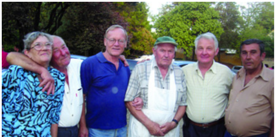
A FŐZŐVERSENYEN RÉSZTVEVŐ CSAPAT

Ezt az is bizonyítja, hogy most is folyamatosan volt érdeklődő vendég a munkáspárti sátor alatt, akiket a párt tagjai közül