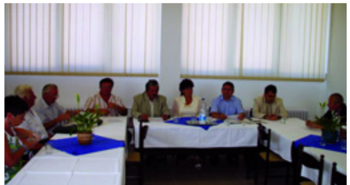
VAJNAIÉK BÁTONYTERNYÉN - AZ MSZP OLDALÁN

Nem lenne helyes rábeszélni a dolgozók millióit arra, hogy olyan pártokra