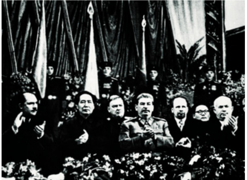
MAO ZEDONG ÉS SZTÁLIN MOSZKVÁBAN 1949-BEN

Ezzel a párt és a hadsereg megmenekült a pusztulástól. 1935 januárjában a párt Politikai Bizottsága Zunyiban értekezletet tartott,