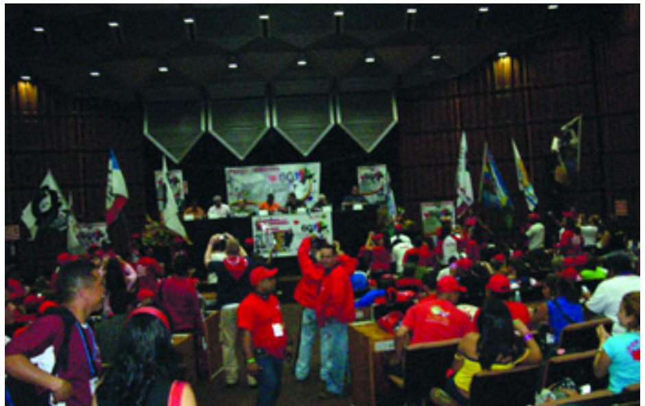
A VIT-EK 60. ÉVFORDULÓJA ALKALMÁBÓL RENDEZETT ÜNNEPSÉG MEGNYITÓJA CARACASBAN

Az ezt követő nap délelőtti szemináriumokkal telt. Elsősorban az amerikai