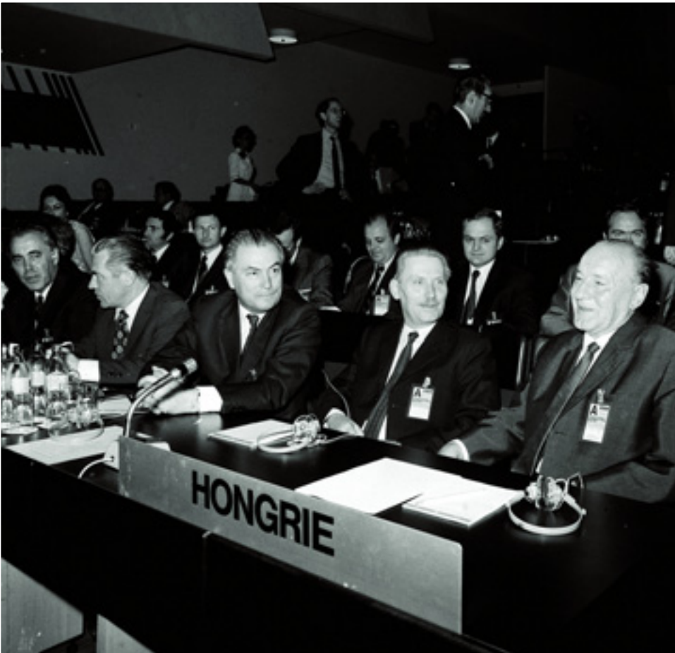
KÁDÁR JÁNOS AZ 1975-ÖS HELSINKI ÉRTEKEZLETEN. MELLETTE LÁZÁR GYÖRGY MINISZTERELNÖK, PUJA FRIGYES KÜLÜGYMINISZTER ÉS MÁS MAGYAR DIPLOMATÁK.

Nem, elvtársak, nem fukarok, hanem takarékosak. És ez nem ugyanaz! Mi Magyarországon nagy szegénységben nőttünk fel. Mindig nagyon vágytunk a jobb életre. S, most, amikor megkaptuk, nem tudjuk megbecsülni. ■