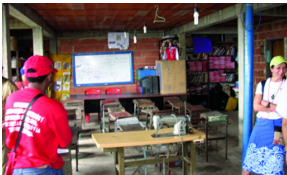
A HEGYI KÖZÖSSÉGNEK ÉPÍTETT ÚJ ISKOLA. SZEGÉNYES, ELMARADOTT, DE LEGALÁBB VAN BENNE TANKÖNYV ÉS PAD

Nagy meglepetést jelentett számukra az a felismerés, hogy bármennyire is megdöbbentő az egymás hegyére-hátára épült házak látványa a hegyoldalakon, a civilizált emberi élethez minden szükséges feltétel adott. Ez pedig úgy volt lehetséges, hogy ennek megteremtéséből mindenki kivette a részét. Az emberek egymást segítve, önmagukat szervezve, közös munkával építettek iskolát, edzőtermet a gyermekeik számára; a Chávez vezette bolívari kormány kedvezményes árú élelmiszereket árusító szupermarketet, infocentert épített és rendszeresen járó, Caracassal összeköttetést biztosító buszjáratokat szervezett; a kubai kormány pedig - olcsó venezuelai olajért cserébe - tanítókat és orvosokat küldött olyan helyekre, ahol korábban orvost, tanítót nem láttak. Ez utóbbiért a közösségek tagjai