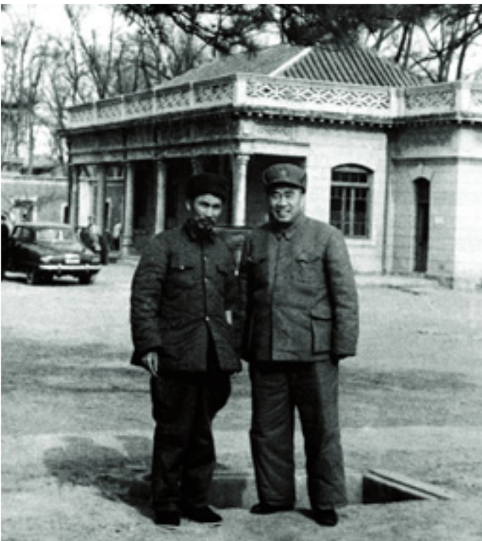
HO CHI MING ÉS ZHU DE 1950-BEN

A KB titkárságába Mao, Zhu De, Liu Shaoqi, Zhou Enlai és Ren Bishi kerültek. A párt elnökévé Mao Zedongot választották. ■