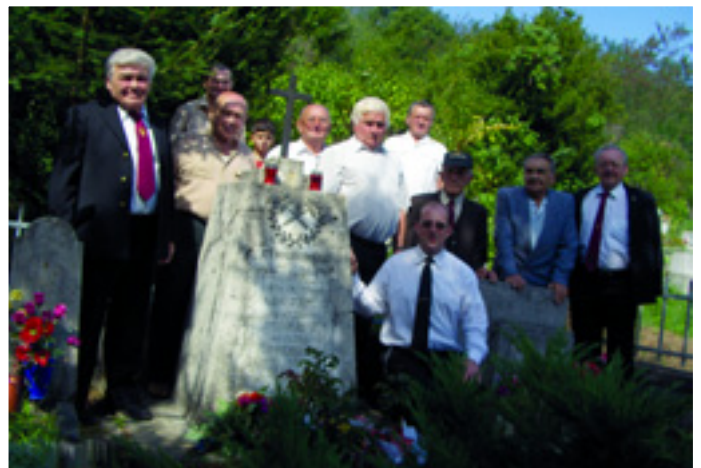
MEGEMLEKÉZÉS A BAGLYASALJAI EMLÉKMŰNÉL

az értelmetlen világháborúval szembeni ellenállás résztvevői, hősei voltak. Nem lehet, hogy az ő áldozatuk felesleges, nem enged-