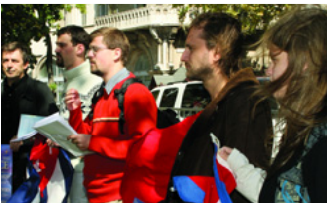
SAJTÓTÁJÉKOZTATÓ AZ AMERIKAI NAGYKÖVETSÉG ELŐTT

A sajtóközlemény teljes terjedelmében olvasható a Munkáspárt weboldalján, a www.munkaspart.hu -n. ■