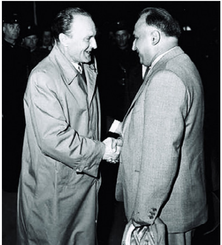
KÁDÁR JÁNOS ÉS TODOR ZSVKOV 1957-BEN

Hitetlenkedve fogadtam szavait. Mégis, hogy kerülne ide Kádár János? De