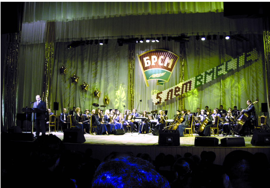
A BELORUSSZ KÖZTÁRSASÁG IFJÚSÁGI UNIÓJÁNAK SZÜLETÉSNAPI RENDEZVÉNYE. ÜNNEPI BESZÉDET MOND LEONYID KOVALEV, A SZERVEZET ELSŐ TITKÁRA

A Baloldali Front a jövőben is kiemelten kezeli mind a Demokratikus Ifjúsági Világszövetségben belül, mind a külkapcsolatainak terén is az együttműködést egykori szocialista országokkal. Mint idén is, jövőre is meg kívánjuk rendezni a kelet-európai kommunista ifjúsági szervezetek tanácskozását. Ez nekünk a szervezeti életünkben is sokat segít. ■