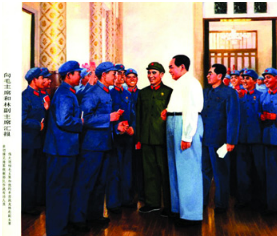
MAO ZEDONG, LIN BIAO ÉS ZHOU ENLAI EGY KORABELI PROPAGANDAKÉPEN

A kudarc ténye felbátorította Mao Zedong koncepciójának ellenfeleit. Ennek a csoportnak