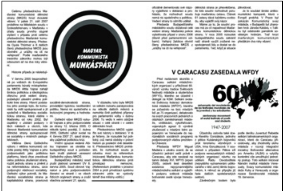
A MLADA PRVADA (FIATAL IGAZSÁG), A CSEH KOMMUNISTA IFJÚSÁGI UNIÓ ÚJSÁGJA EGÉSZ OLDALALAS CIKKBEN FOGLALKOZNAK A PERREL ÉS KINYÍLVÁNÍJTJÁK A SZOLIDARITÁSUKAT

Ez a Budai Várban, 2007. augusztus 25-i végbement események fényében még inkább szégyenteljes. Ekkor alakították meg a félkatonai Magyar Gárdát. Önmagáért beszél az,