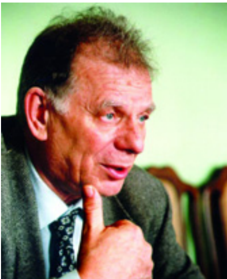
ZSORESZ ALFJOROV AKADÉMIKUS

December 2-án ugyanis Oroszország választ. A pártlisták szerepe most azért nőtt meg, mert a 2005. évi törvénymódosítás óta csak listás szavazás van. Putyin megszüntette a 225 egyéni mandátumos helyet. Ezzel a függetlenekre és a kis pártokra mérték csapást, mivel egy-egy nagyon ismert személlyel ők szerezték meg ezeket a mandátumokat. Ezzel együtt a parlamenti küszöböt is felemelték 5 százalékról 7 százalékra. Még a pártok bejegyzésének feltételeit is szigorították. Még mondja azt valaki, hogy nincs demokrácia!