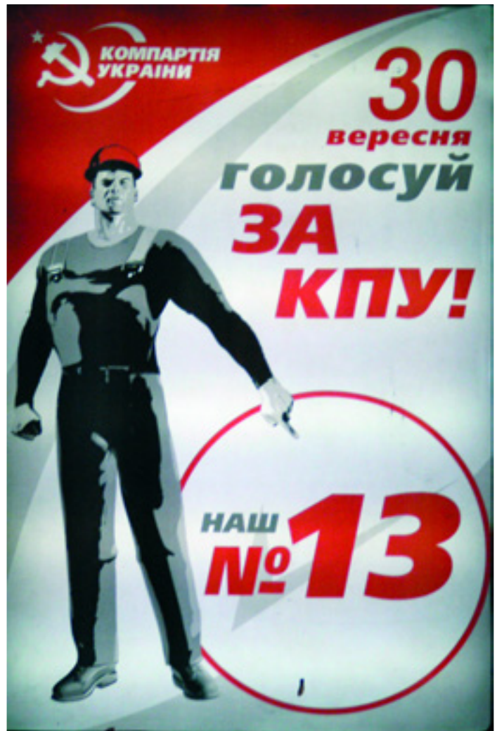
AZ UKRÁN KOMMUNISTA PÁRT VÁLASZTÁSI PLAKÁTJA

A kommunistákat az 55 éves Pjotr Szimonyenkó vezeti, aki a kezdetektől fogva a párt első titkára. Az elmúlt választások óta ő irányította a párt 21 fős parlamenti frakcióját is. Az elmúlt években sokat tettek a párt