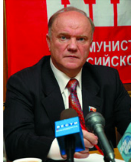
GENNAGYIJ ZJUGANOV, AZ OFKP ELNÖKE

Az OFKP programja is e stratégiának megfelelően alakul. "Hét lépés a múlt jövőbe"- ezt a címet adták a választási programnak. Az első lépés a stratégiai ágazatok államosítása, nacionalizálása. A második lépés az érvényben lévő törvények átvizsgálása jelenti. Az új törvényeknek biztosítaniuk kell a szovjet korszakban érvényes szociális, lakás- és egyéb normák visszaállítását. A harmadik lépés a gazdaság gyors ütemű fejlesztését jelenti. A negyedik lépés keretében a kommunisták bevezetnék a képviselők visszahívhatóságát, igazi több-pártrendszert teremtenének. Az