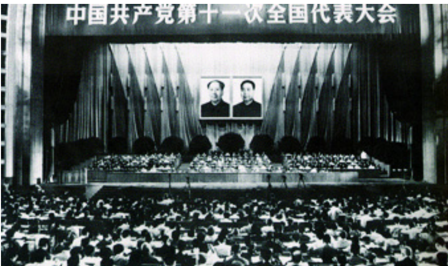
A KÍNAI KOMMUNISTA PÁRT 11. KONGRESSZUSA

A párt elnöke ismét Hua Guofeng lett. Alelnök lett Ye Jianying, Deng Xiaoping, aki vitathatatlanul a reformerök szellemi vezére, Li Xiannian (1909-1992), aki Zhou Enlai kormányában 1973-ban pénzügyminiszter volt, a reform híve, előbb a parlament elnöke, majd 1983-tól - Mao Zedong és Liu Shaoqi után - Kína harmadik államelnöke volt. Ugyancsak alelnök lett Wang Dongxing (1916-), aki döntő szerepet játszott a négyek bandájának felszámolásában. 1960 óta ő volt ugyanis a 8341. számú katonai alakulat, lényegében a kormányórság parancsnoka. Mao halála után Wang Dongxing Hua Guofeng oldalára állt, és pozícióját egészen Deng Xiaoping hatalomra kerüléséig megtartotta. A fenti vezetők alkották a Politikai Bizottság Állandó Bizottságát is. ■