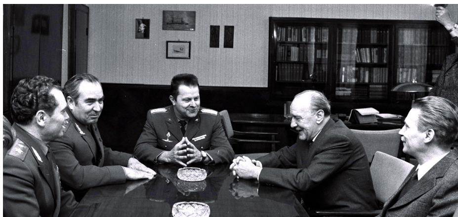
KÁDÁR JÁNOS ÉS KULIKOV MARSALL

Kádár Jánosnak természetesen szerepe volt a Néphadsereg fejlesztését, és általában az ország védelmi képességének erősítését szolgáló intézkedések meghozatalában. Magyarország nem volt gazdag ország, és bizony nehezen született minden olyan döntés, amikor katonai célokra kellett pénzt költeni. Ilyenkor nem egyszer a szovjet szövetségesekkel kellett kemény vitákba bonyolódni. A szovjet hadvezetés mindig több és korszerűbb, következképpen drágább fegyvert akart megvetetni velünk, mint amit szerettünk volna. Ennek sok oka volt. A szovjet katonai vezetés, amelynek vállán nyugodott a szocialista és a kapitalista világrendszer közötti egyensúly megőrzésének súlyos terhe, jogosan aggódott, és nem egyszer tette szavá, hogy nem lehet fenntartani az egyensúlyt, ha, mondjuk, a magyar pilóták töredékét repülnek annak, amit a szovjetek repülnek, nem is beszélve az amerikaiakról. Nem lehet megőrizni a békét, ha fegyveres erőink nem követik a technika fejlődését. Voltak persze saját szovjet gazdasági érdekek is. A haditechnika zömét ugyanis a szovjet ipar termelte, és mi fizettünk a termékekért, nem is keveset.