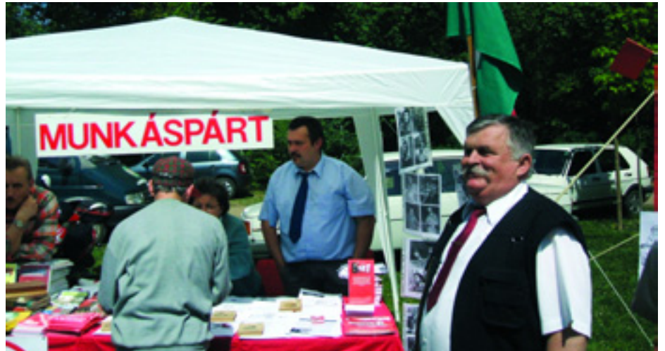
A MUNKÁSPÁRT SÁTRA SZEGEDEN, EGY HELYI ÜNNEPSÉGEN

"Miért nem dolgoztok, miért nem szóltok bele a város életébe?" Engedtessek meg, hogy elmondjam ennek a kérdésnek néhány alvázlatát. Mind-mind megtörtént eset, saját fülemmel hallottam. Miért nem indultatok az önkormányzati választásokon Pápán, Sopronban és még sok helyen, noha volt és van is munkáspárti szervezet? Miért nem hangoztatjátok a véleményeteket Szolnokon, noha korábban bent voltatok az önkormányzatban és ma is erős a párt? Miért nem tiltakoztok az ellen, hogy Nagykörösről elvitték a munkaügyi hivatalt? Miért nem jöttetek felénk a választások óta, pedig szívesen látunk titeket? A helyi sajtó rendre azt kérdezi, hogy miért nem szervezünk