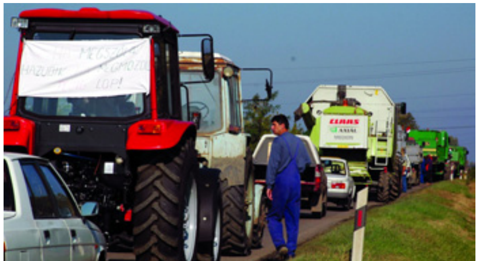
GAZDATÜNTETÉS 2006, MEZŐTÚR