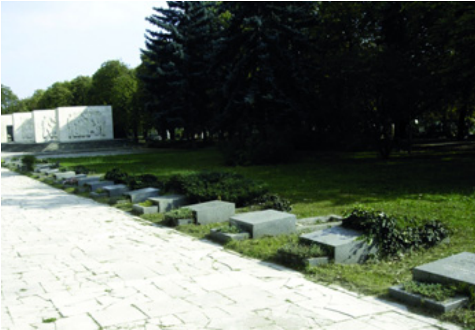
A MÁRTÍRSÍROK ELHANYAGOLT, LEPUSZTULT ÁLLAPOTBAN

Ez évben Kádár János halálának évfordulója előtt budapesti - fiatal, középkorú és idősebb - aktivistáink egy lelkes csoportja rendbe tette a Kerepesi úti temetőben a Munkásmozgalmi Pantheon környékét. Ezt az akciót hagyománnyá tesszük a jövőben is.