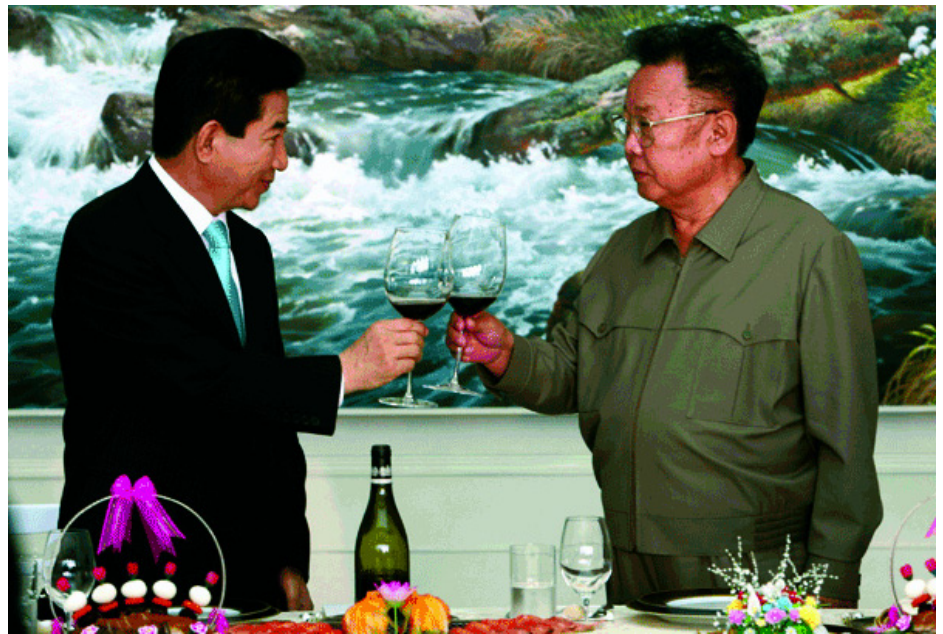
ÉSZAK ÉS DÉL-KOREA VEZETŐI

A Koreai Munkapárt a szocializmus építésének folytatása mellett döntött, meghirdették a hadsereg-központú szocialista építés elméletét. Ez magyarul azt jelenti, hogy a gazdaságban is, a mindennapi életben is fokozottan támaszkodnak a fegyveres erőkre, amely a párt mellett a legszervezettebb erő a KNDK-ban. Az új vezetés nehézségeit növelte az is, hogy az USA Koreát szemelte ki "könnyű