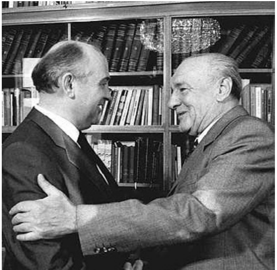
MIHAIL GORBACSOV ÉS KÁDÁR JÁNOS