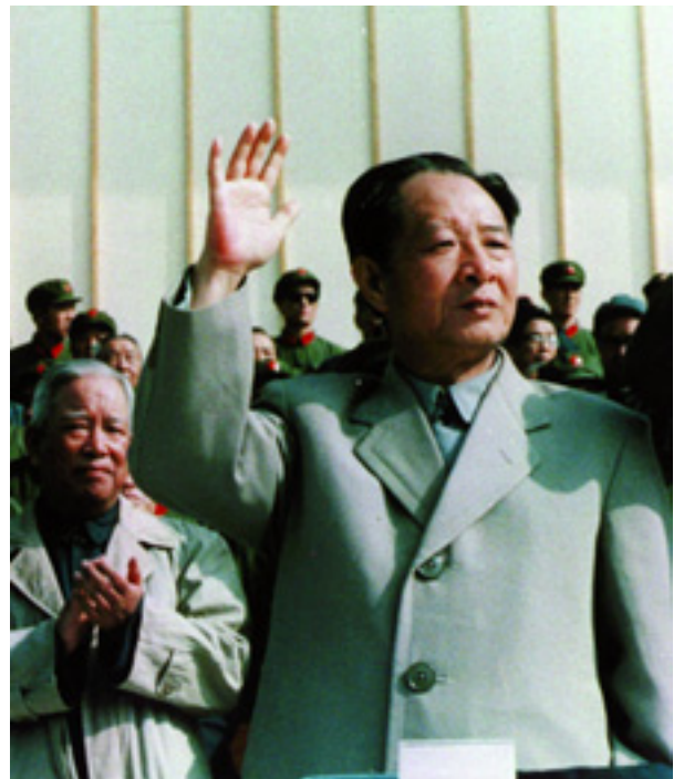
HU YAOBANG 1981-BEN

Őt ma, nem pontos szóval élve a "keményvonalasok" vezetőjének lehetne nevezni, aki mindvégig felhívta a figyelmet a reformpolitika veszélyeire. 1989 után ő az egyike a nagy öregeknek, akik a háttérből hoznak meghatározó döntéseket. ■