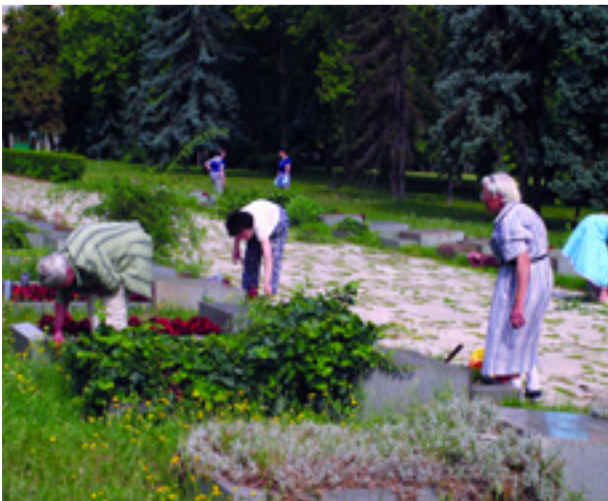
A MÁRTÍRSÍROK TAKARÍTÁSA JÚNIUSBAN

Akkor az aszonyok egy csoportja a Pantheonhoz vezető sírsétányon lévő mártírsírokat is megszüpítette. Láttuk, bizony azok is eléggé elhanyagolt állapotban voltak. Itt fogant meg a gondolat: nem csak a munkásmozgalmi mártírjainak emlékét kell őrizni, de tettekre is szükség van, rendszeresen ápolnunk is kell a sírjaikat, szervezzük meg a folyamatos védnökséget a sírok felett.