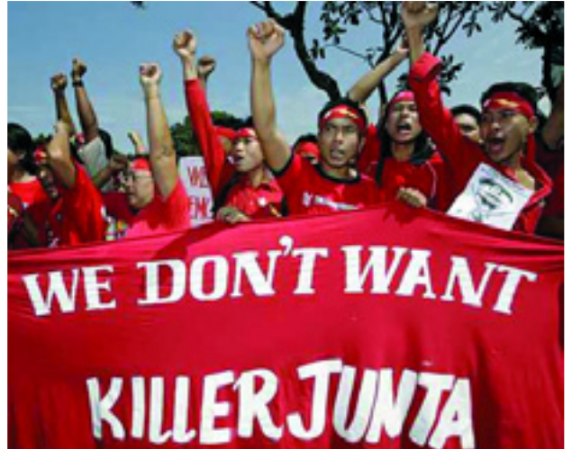
BURMAI FIATALOK TŰNTETÉSE. A TRANSPARENS FELIRATA: NEM AKARUNK GYILKOS JUNTÁT!

Abban a hitben, hogy az antiimperialista harc folytatódni fog, hogy felkeljen a reakciós