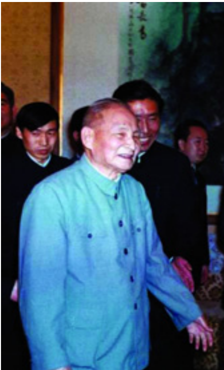
CHEN YUN, A PÁRTFEGYELMI BIZOTTSÁG ELNÖKE

A 11. kongresszus 1977-ben - mint láttuk - lezárta ugyan a "Kulturális Forradalom" időszakát és utat nyitott a reformok előtt, de a felemás megoldások, a kompromisszumok megmaradtak. Ezt maga, a pártelnök Hua Guofeng politikája is jelezte. Világos volt, hogy előbb-utóbb változásra lesz szükség. A 11. kongresszuson választott Központi Bizottság