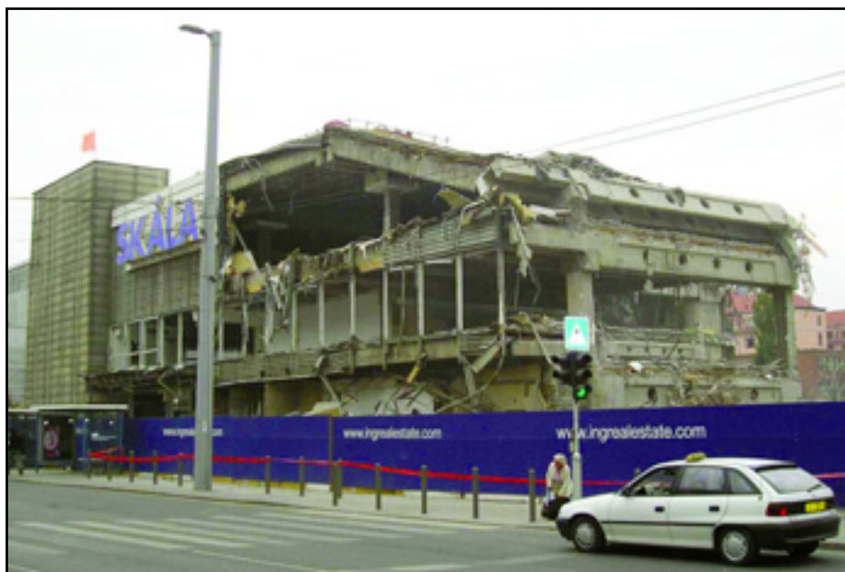
AZ EGYKORI FEHÉRVÁRI ÚTI SKÁLA ÁRUHÁZROMOKBAN

Nem vonom kétségbe, hogy a Skála a mai helyén (ahová áttelepült) esetleg épp olyan jól üzemel, de ott már nem esik útba. S még azt sem vonom kétségbe, hogy a Skála eredeti épületének helyén valami nagyszerű új dolog