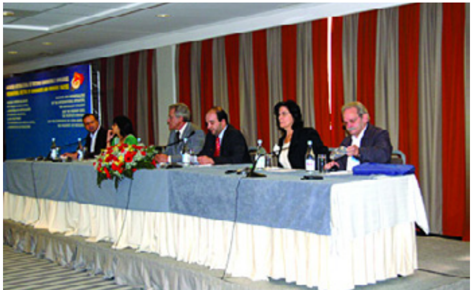
A KOMMUNISTA PÁRTOK 2007-ES LISZABONI TANÁCSKOZÁSA

akiket a Munkacsoport meghív. Meghívást pedig azok a pártok kapnak, amelyek szerepelnek a Solidnet pártlistáján. Ez a lista az elmúlt években alakult ki, tükrözi a mozgalom sokszínűségét, ugyanakkor gátat kíván szabni annak, hogy a kommunista pártokról leszakadó szakadár pártocskák, revizionista csoportocskák bejussanak a kommunisták pártok fórumaira. Magyarországról a Magyar Kommunista Munkáspárt vesz részt a munkában. A 2006-os párt erőfeszítéseket tett, hogy a mozgalom pártjai elismerjék, de sikertelenül. Minszkben nincs helye a szakadároknak. ■