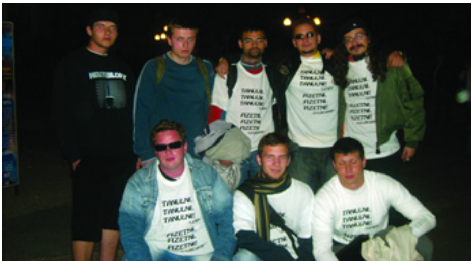
A BALOLDALI FRONT HEVES MEGYEI TAGJAI A TANDÍJ ELLENI TŰNTETÉS UTÁN

A hatalomnak bátran üzenő kiváló beszédek után már szálltak is vissza a frontosok a többi diákkal a buszra, hogy városunkban, Egerben tüntessünk tovább. Estére vissza is értünk, lassan rendeztük a demonstrálók alakzatát, fáklyát kapott mindenki, s vonult is a diákság a Dobó térre, a Líceum előtti részről. A demonstráció végén pedig a fáklyából "No tandíj!" feliratot formáztak ki. Véleményünk szerint a tüntetés eredményes, elég figyelemfelkeltő volt, s minél több ilyenre van szükség. Küzdeni kell az emberekért, jobban mint eddig talán valaha is. ■