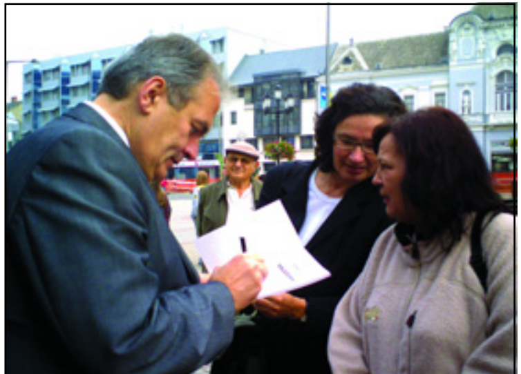
AZ EMBEREK SZABOLCS MEGYÉBEN IS KÍVÁNCSIAK VOLTAK RÁNK, SZÍVESEN VETTÉK ÉS DEDIKÁLTÁTTÁK A BALSZEMMEL CÍMŰ KÖNYVET

Ide már nem jön a multi. A helyi, magyar vállalkozó itt van, de őt tönkre teszi a nagy adó, na és az emberek pénztelensége. ■