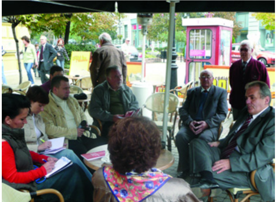
SAJTÓTÁJÉKOZTATÓ NYÍREGYHÁZA BELVÁROSÁBAN