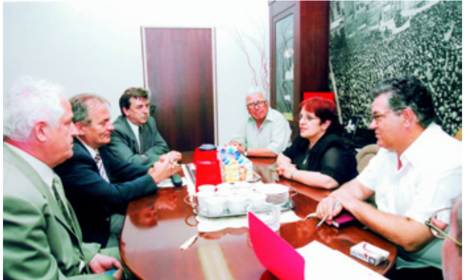
A MUNKÁSPÁRT VEZETÉSÉNEK TALÁLKOZÓJA A GÖRÖG KOMMUNISTA PÁRT ELNÖKSÉGÉVEL

A kommunista mozgalom e konkrét együttműködési formája a Görög Kommunista Párt által kezdeményezett éves találkozóból nőtt ki. 2005 novemberében először szervezték meg a görög kommunisták a mostani formában a tanácskozást Athénban. Akkor 73 párt volt jelen. 2007-ben a Portugál Kommunista Párt vállalta a rendezést. 63 párt vett részt, 17 párt különböző okok miatt szándéka