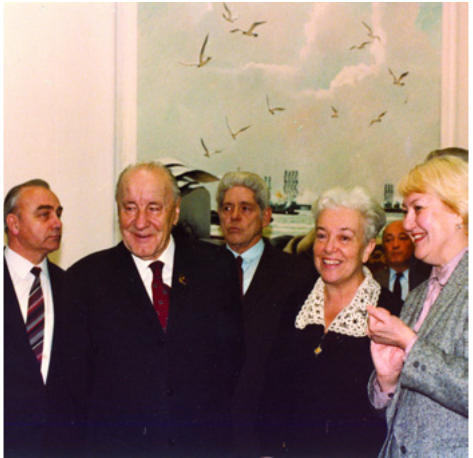
KÁDÁR JÁNOS MOSZKVÁBAN, A MANEJS MÚZEUMBAN

A KB Külügyi Osztálya jelentette a változásokat Kádár Jánosnak. Kádár nem foglalkozott az ajándékok részleteivel, legfeljebb a fő vendéglátó ajándékára mondott igent vagy nemet. Gorbacsov új ember, ráadásul az új reformszellem megtestesítője, legalábbis akkor így gondolták, ezért nem lehetett akármilyen ajándékkal meglepni. Eszünkbe jutott, hogy 1983-ban Gorbacsov bu-