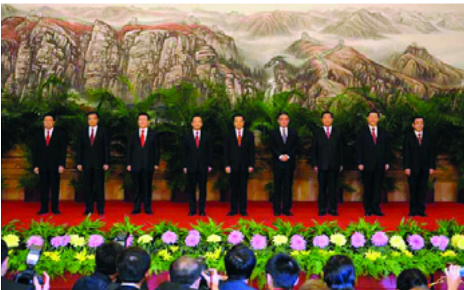
A KÍNAI KOMMUNISTA PÁRT ÚJ VEZETÉSE

A Politikai Bizottság korábbi Állandó Bizottságából kimaradt a hatvanas éveiknek a végén járó három vezető, a 68 éves Zeng Qinhong, a 69 éves Wu Guazheng és a 72 éves Luo Gan. Tagja lett: Hu Jintao (sz. 1942), aki 2002-ben Jiang Zemintől vette át a főtitkári tisztséget. Wu Bangguo (sz. 1941), a kínai parlament elnöke, Wen Jiabao (sz. 1942), miniszterelnök, Jia Qinglin (sz. 1940), a Népi Konzultatív Tanács elnöke, Li Changchun (sz. 1944), a párt propaganda-vezetője, Xi Jinping (sz. 1953), a sanghaji pártbizottság első titkára. Li Keqiang (sz. 1955), a liaoningi tartomány pártbizottságának első titkára, He Guoqiang (sz. 1943), a KB párt szervezési vezetője és Zhou Yongkang (sz. 1942), aki eddig közbiztonsági miniszter volt. Hu Jintaot választották meg a párt központi bizottsága főtitkárnak, és a Központi Katonai Bizottság elnökének. ■