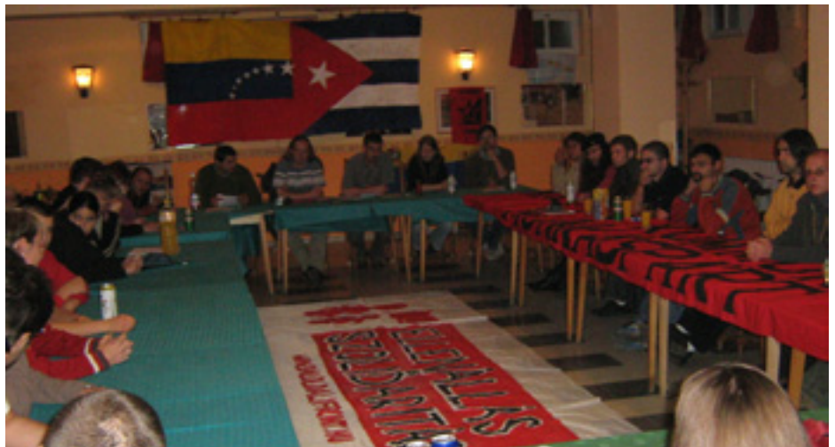
ELŐADÁS A KIPLAKÁTOZOTT, KIDÍSZÍTETT KÜLÖNTEREMBEN

A táborba az ország tizenhat pontjáról érkeztek fiatalok, amihez a párt mozgósítása nagyban hozzájárult, ezúton szeretnénk is köszönetet mondani ezért a segítségért, továbbá azokért az anyagi áldozatokért, amit a párt tag-sága hozott, hogy minél több fiatal részt tudjon