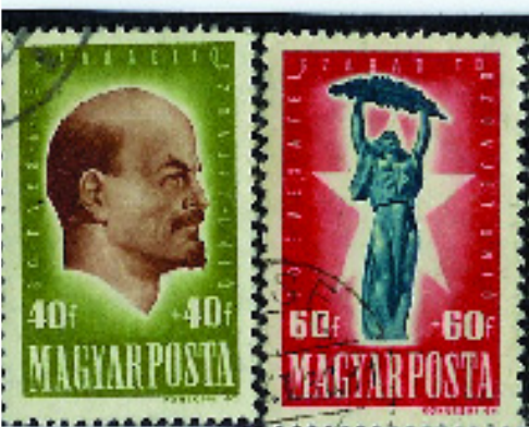
AZ ELSŐ, ITTHON KIADOTT LENIN-BÉLYEG

Vlagyimir Iljics Lenin nevét és tanításait az egész világon ismerik, hiszen egyre többen lapozgatják és tanulmányozzák műveit, mert Lenin a XXI. században is időszerű, bár a 90-es évek elején különböző okok miatt nagyot fordult a világ.