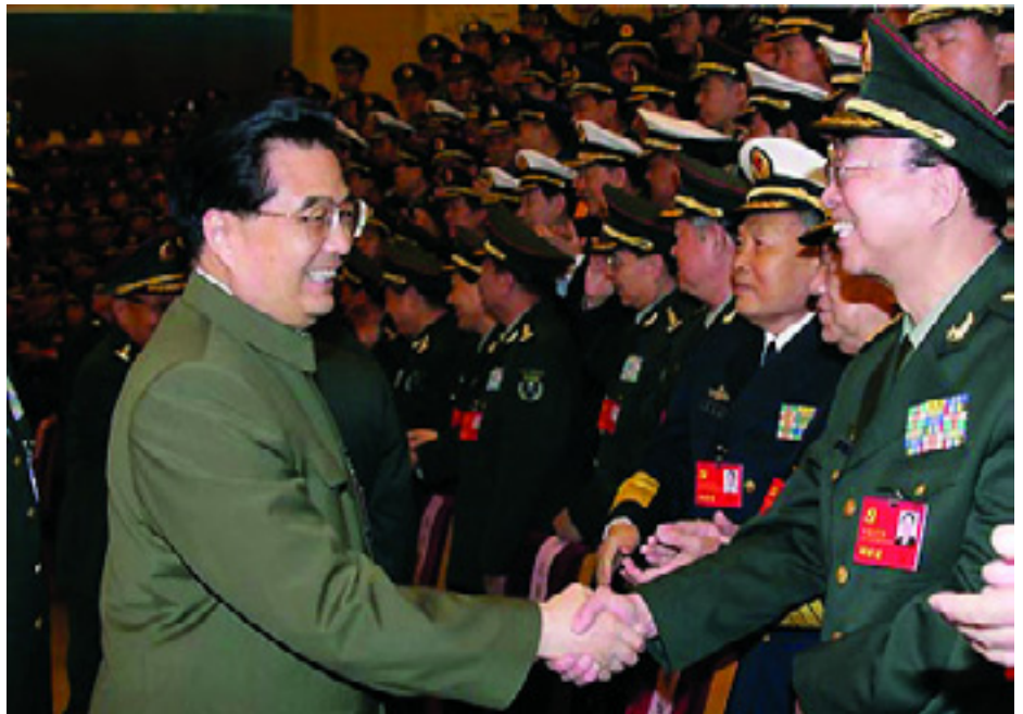
HU JINTAO FŐTITKÁR KATONAKÜLDÖTTEKSEL TALÁLKOZIK

Hu Jintao leszögezte: a kongresszuson hozott döntések és az ott megfogalmazott elképzelések, valamint az elért eredmé-