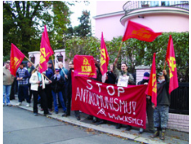
CSEH KOMMUNISTÁK TÜNTETNEK A PRÁGAI MAGYAR NAGYKÖVETSÉG ELŐTT

Vojtech Filip, a KSCM elnöke Thürmer Gyulához írott levelében leszögezte, hogy a továbbiakban is határozottan kiállnak a Munkáspárt mellett. Minden befolyását beveti az Európai Parlament baloldali frakciójában is, hogy a frakció még erőteljesebben sikraszálljon ezen antidemokratikus eljárás ellen.