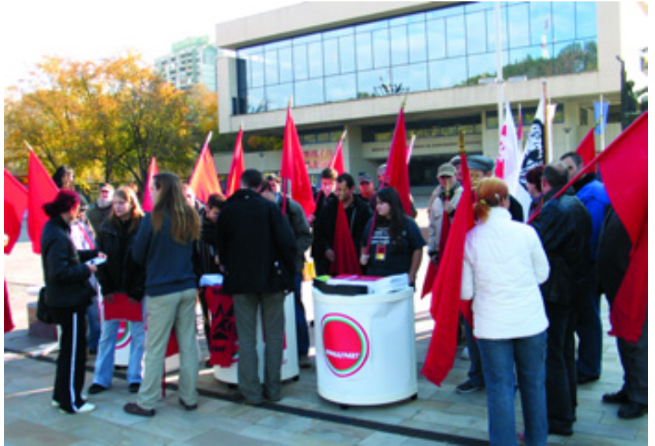
SAJTÓTÁJÉKOZTATÓ SALGÓTARJÁNBAN, A FIATALOK MUNKANÉLKÜLISÉGÉVEL KAPCSOLATBAN

Természetesen mind az előadásokon, mind a külön beszélgetéseken az volt a fő téma, hogyan lehet szervezni a Baloldali Frontot, milyen tapasztalatok vannak, akár országosan, akár helyi szinten. Abban mindenki egyetértett, hogy a