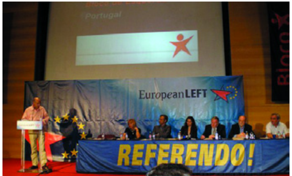
AZ EURÓPAI BALOLDALI PÁRT TAGSZERVEZETEI ELNÖKEINEK TANÁCSKOZÁSA LISSZABONBAN

A tanácskozáson kinyilvánították: az EBP minden EU-tagállamban népszavazást javasol arról a reformszerződésről, amelyet az EU állam- és kormányfői most véglegesítettek Lisszabonban.