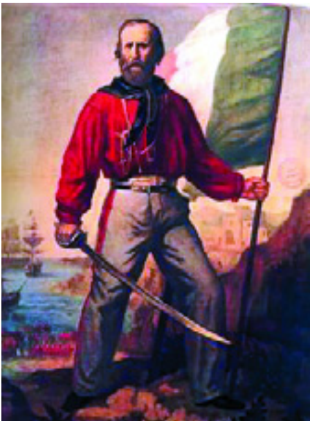
GARIBALDI VÖRÖS INGE

- A párt egységének külső demonstrálására eddig is használtunk eszközöket. Ilyen