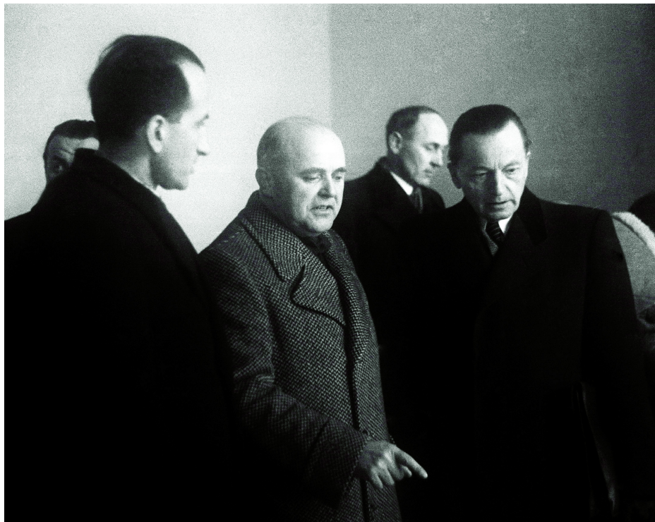
MOLNÁR ERIK (JOBBRA), MINT NÉPJÓLÉTI MINISZTER A KARCAGI KÓRHÁZ AVATÁSÁN 1946-BAN

Egy Vlagyivosztk melletti hadifogolytáborban kapcsolatba került a szocialista forradalomért küzdő internacionalistákkal. A szülői ház hagyományai, az imperialista háború élményei, társadalomtudományi olvasmányai – mindezek mellett Marx és Engels művei – érlelték meg forradalmi világnézetét.