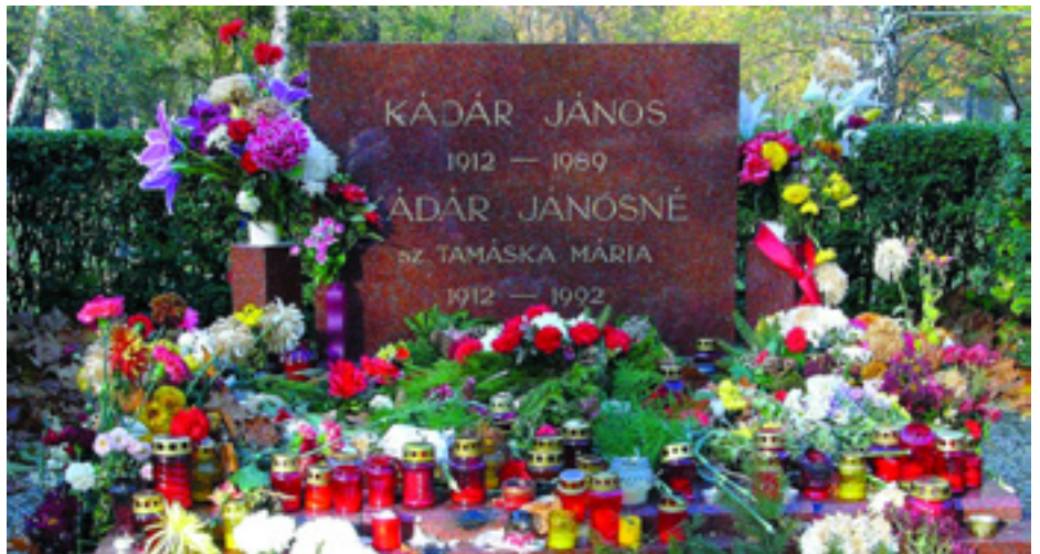
KÁDÁR JÁNOS ELVTÁRS ÉS FELESÉGÉNEK A SÍRJA A KEREPESI ÚTI TEMETŐBEN

Az ügyben az eljárást - rongálás büntett elkövetésének megalapozott gyanúja miatt - a Budapesti Rendőr-főkapitányság haladéktalanul megkezdte. A nyomozás során közel hatszáz személy meghallgatására került sor. A helyszínen rögzített nyomok, illetve a hamvak és csontok elemzése érdekében haemogenetikai, fizikai, vegysz, igazságügyi antropológiai és nyomszakértő bevonása vált indokolttá. A szakértői vélemények, illetve a tanúk által előadottak alapján - az alapos