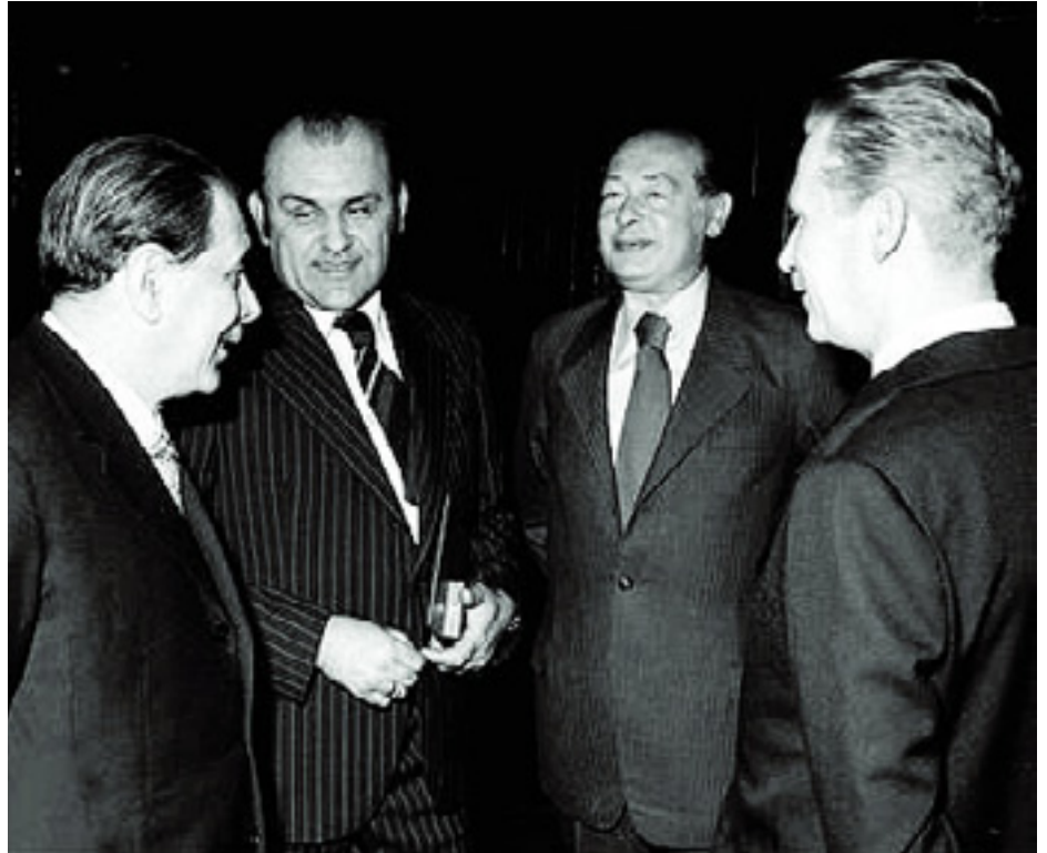
ACZÉL GYÖRGY, HOFI GÉZA, KOMLÓS JÁNOS ÉS LÁZÁR GYÖRGY MINISZTERELNÖK

A viccek szoltak Kádár találékonyságáról. A ravasz népi hős köszönt vissza a viccekből, aki mindig kijátszotta a rosszakat és az erősebbeket. Például így: Magyarország labdarúgó-válogatottja a Szovjetunió csapattal játszik barátságos mérkőzést, amikor a