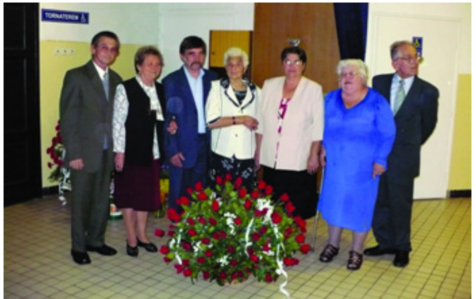
AZ ÜNNEPELT KÖZÉPEN ÉS A GYULAI PÁRTSZERVEZET NÉHÁNY TAGJA

Az alkalomhoz illően a gyulai párt-szervezet tagsága nevében 100 szál pirosrózsából készült virágkosa-