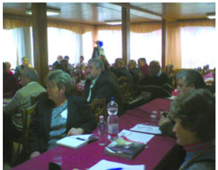
A SZOLNOKI TANÁCSKOZÁS RÉSZTVEVŐI

A mostani tanácskozás rendhagyó volt abból a szempontból is, hogy ezer-ezer forint részvételi díjat fizetett minden résztvevő, amelyben benne volt az ebéd költsége, s a tanácskozásnak helyszínt adó volt úttörőtábor egynapos bérleti költsége is. A párt mai anyagi helyzetében ez is követendő példa. ■