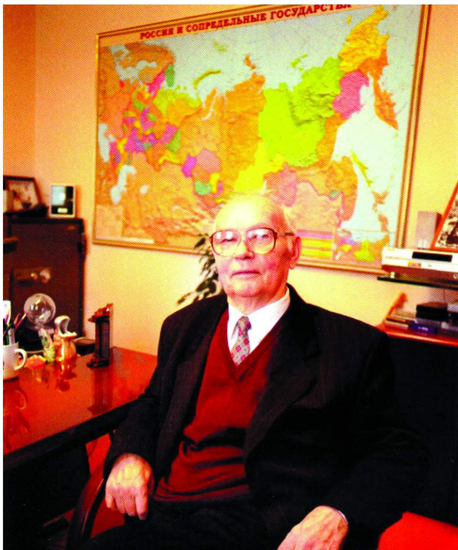
VLAGYIMIR ALEKSZANDROVICS KRJUCSKOV

Először augusztusban kétoldalú csúcstalálkozón, majd novemberben a