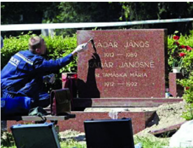
AMIKOR MÉG NYOMOZTAK...