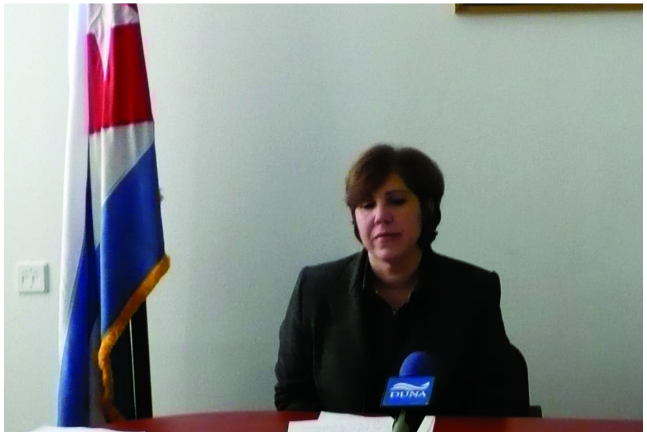
SORAYA ELENA ÁLVAREZ NÚÑEZ, A KUBAI KÖZTÁRSASÁG MAGYARORSZÁGI NAGYKÖVETE

A nagykövet asszony nagyon higgadtan elmondta, hogy egyelőre létezik nemzetközi jog, létezik az ENSZ alapokmánya, és ezek szerint egyetlenegy ország parlamentjének sincs joga arra, hogy "más nép szuverén módon választott jogi, politikai, gazdasági és társadalmi rendszerének a megváltoztatása legyen szándéka, és másokat arra ösztönözzön." A nagykövet világosan kijelentette: "A Magyar Országgyűlésben Kuba ellen benyújtott kezdeményezés (Politikai nyilatkozattervezet, P/4267) durva beavatkozás a Kubai Köztársaság belügyeibe, a nemzetközi jog