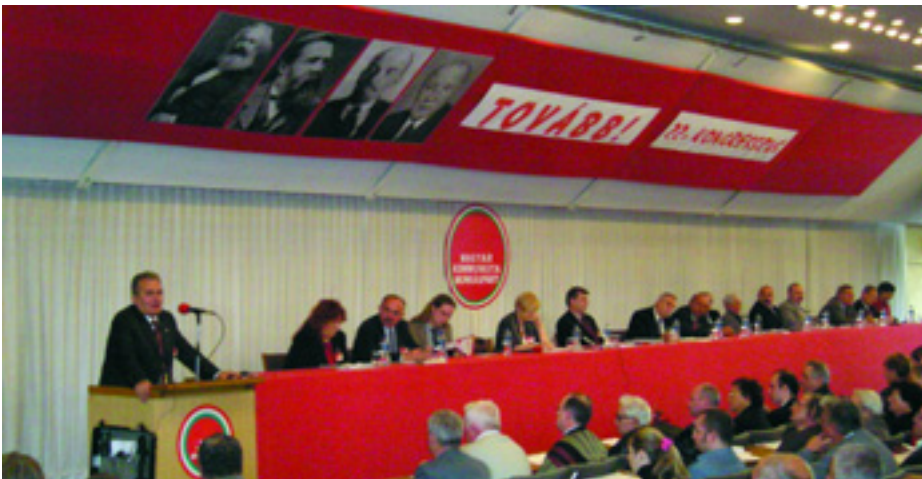
EGY ÉVVEL EZELEŐTT - A MUNKÁSPÁRT KONGRESSZUSA 2006. NOVEMBER 4-ÉN

A történelem most újra lehetőséget kínál! Ne legyünk hát restek, ne legyünk fáradtak és beletörődöek, használjuk ki! Boldog születésnapot, Munkáspárt!