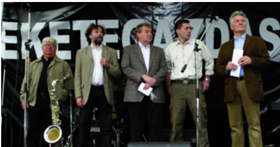
OSZTÁLYHARC MAGYARORSZÁGON - SZAKSZERVEZETI TŰNTETÉS 2007 NOVEMBERÉBEN

A tőke nem azért rossz, mert jó vagy rossz emberek irányítják. A tőke azért rossz, mert a természete ilyen. A tőke lényege, hogy egyre több és több pénzt szerezzen, egyre nagyobb méretekben termelje újra önmagát.