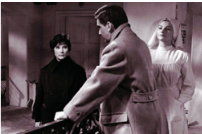
JELENET AZ ALBA REGIA CÍMŰ FILMBŐL

Kádár szeretettel hallgatta az egykori katona visszaemlékezését, tudva, hogy ezek az emberek tényleg életük legjavát adták a szovjet hadsereg győzelméért, ami nekünk, magyaroknak a németek kiűzését, a felszabadítást is jelentette. És a szerelem? - fordította meg Kádár a beszélgetés menetét. Tudja, Kádár elvtárs, a szerelemnek a legritkábban volt helye a háborúban, ellenséges területen pedig szinte soha. Persze, ha a sors '45 elején Székesfehérváron nem marcona németekkel hoz össze, hanem, mondjuk a maguk Gábor Miklóásával, ki tudja, mi lett volna belőle? ■