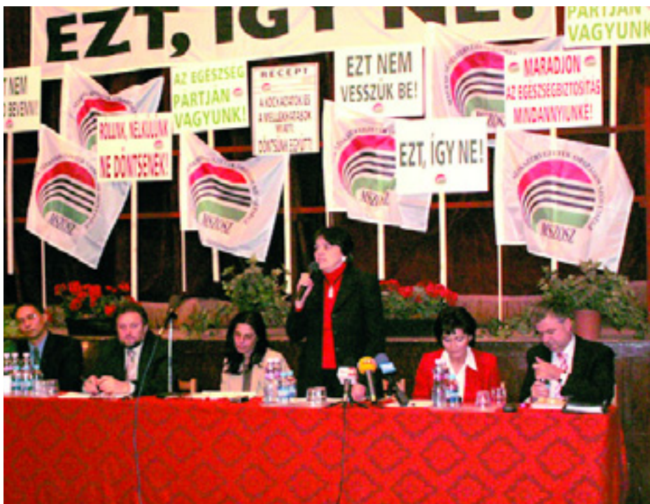
AZ MSZOSZ SZÖVETSÉGI TANÁCSÁNAK ÜLÉSE DECEMBER 7-ÉN

MSZOSZ: A TÖRVÉNY SEM TETSZIK, A SZTRÁJK SEM TETSZIK