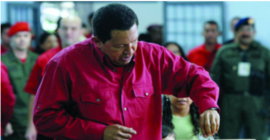
HUGO CHÁVEZ ELNÖK PIROS INGEBEN SZAVAZ

A választások után George W. Bush amerikai elnök is nyilatkozott, ünnepeelve a „venezuelai nép demokráciáját“, hogy „nem akarnak diktatúrát“, miközben az USA megint belszól egy másik ország belügyeibe, azzal, hogy a népszavazás ellen kampányoló ellenzéki pártokat ismételtelen nagy pénzüsszegekkel támogatta. Megpróbálta az amerikai elnök is általában úgy beállítani ezt a népszavazást, hogy Chávez diktatúrára tör, miközben a referendumban is csak abban lehetett szavazni, hogy ne legyen limitje a választhatóságnak, azaz mandátuma lejártával Cháveznek minden alkalommal újra és újra meg kellene magát mérettetnie a választásokon. Egyébként az Egyesült Államokban éppen George Bush pártja vetette fel ugyanazt, hogy egy elnök többször is újraválasztható legyen, ne csak kétszer, mint most. ■