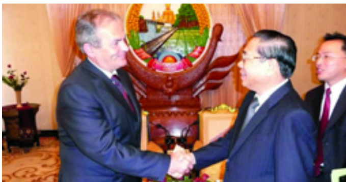
LAOSZ KÖSZÖNETET MONDOTT A MAGYAR NÉPNEK - THÜRMER GYULA LAOSZI TALÁLKOZÓJA A PÁRT FŐTITKÁRÁVAL