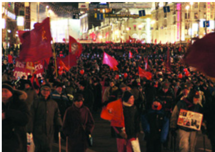
TÍEZREK MOSZKVA UTCÁIN A NAGY OKTÓBER 90. ÉVFORDULÓJÁN - A MUNKÁSPÁRT RÉSZT VETT A KOMMUNISTÁK VILÁGTALÁLKOZÓJÁN MINSZKBN ÉS AZ ÉVFORDULÓN MOSZKVÁBAN - 2007. NOVEMBER