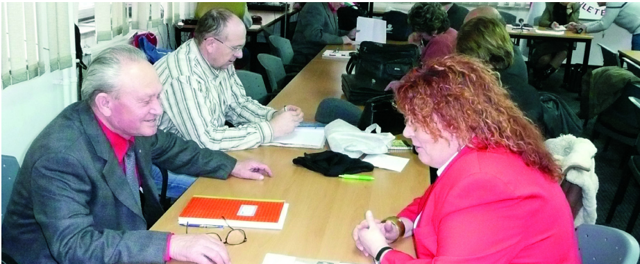
KB-TAGOK BESZÉLGETÉSE A SZÜNETBEN