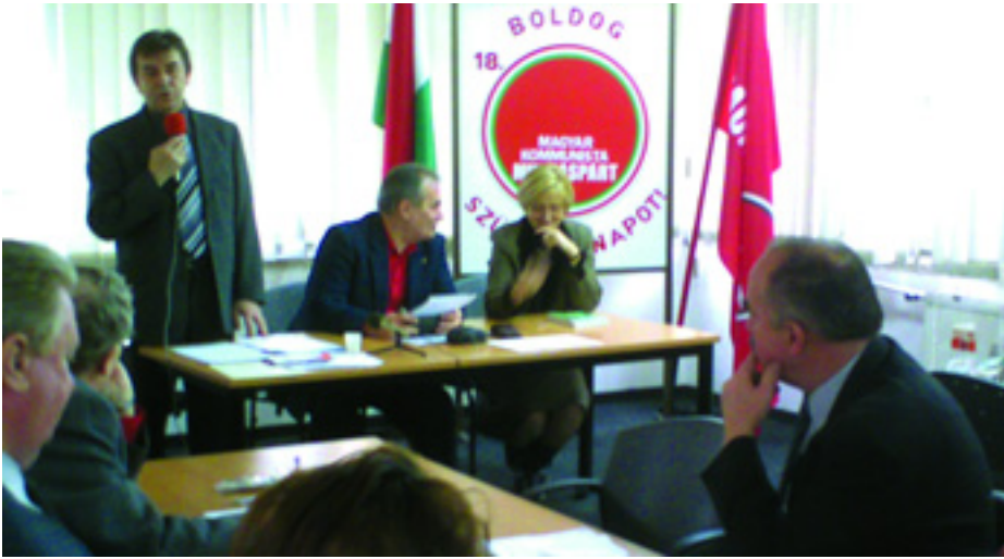
A PÁRT ELNÖKE ÉS A KÉT ALELNÖK A MUNKAÉRTEKEZLETEN

1. A Központi Bizottság megállapítja, hogy a magyar tőkés rendszer válságban van. Magyarország a nemzetközi versenyben egyre inkább elmarad a környező országoktól. Visszaüt a magyar kapitalizmus azon sajátossága, hogy más országoktól eltérően nálunk meghatározó súlya van a multinacionális tőkének. A szocialista-liberális kormány a válság leküzdését abban látja, hogy még nagyobb előnyökhöz juttatja a multinacionális tőkét, és olyan területeket áldoz fel, mint az egészségügy, amelyek alapvetően károsítják az embereket.