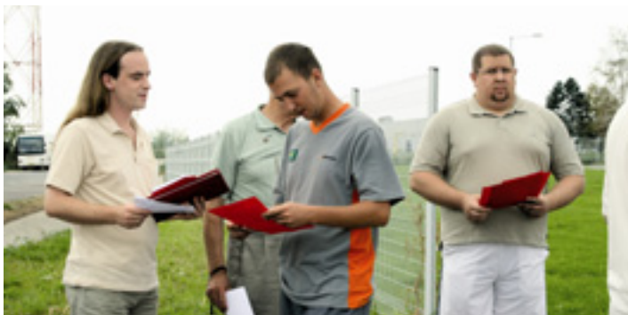
SZOLIDARITÁSI AKCIÓK A HANKOOK GYÁR MUNKÁSAIVAL - A MUNKÁSPÁRT SZAKSZERVEZETI MUNKACSOPORTJA MEGZAVARTA AZ ÁLLÓVIZET A DÉL-KOREAI GYÁR ÜGYEI KÖRÜL - 2007- AUGUSZTUS