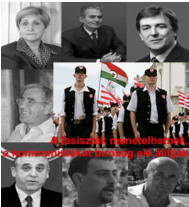
A fasiszták menettelhetnek, a kommunistákat bíróság elé állítják