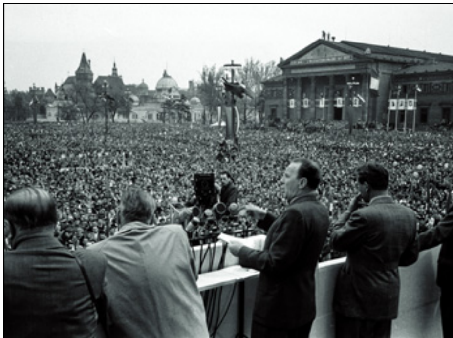
KÁDÁR JÁNOS BESZÉDET MOND A HŐSÖK TERÉN 1957. MÁJUS ELSEJÉN

Kádár János fontosnak tartotta, hogy az üzenet jellegű nagy beszédei tükrözzék a párt, a pártvezetés véleményét, hangulatát. Ha megtalálta a fő mondanivalót, és megérezte a támogatottságot, már nem lehetett volna rábeszélési változtatásokra. 1985-ben Varsóban, a Varsói Szerződés Politikai Tanácskozó Testületének ülésén például magához hívta a magyar küldöttség tagjait, és átadta a szigorúan bizalmas