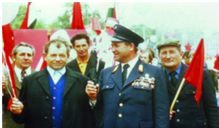
KÉRI ELVTÁRS KÖZÉPEN TISZTI EGYENRUHÁBAN

Magyar Kommunista Munkáspárt Csepeli szervezete