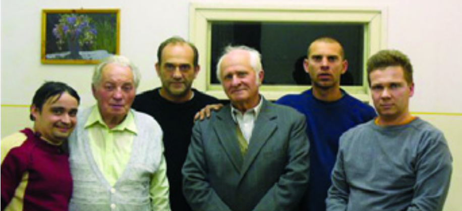
A NÉGY ÚJ PÁRTTAG ÉS A KÉT KITÜNTETETT

A Munkáspárt balassagyarmati szervezete 2007. december 14-én ünnepi taggyűlésen emlékezett meg pártunk újjáalakulásának 18-dik évfordulójáról.