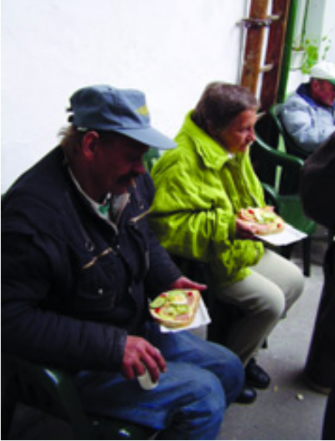
ÉTELOSZTÁS A HAJLÉKTALANSZÁLLÓN

Idézet az Utca Embere Önkéntes Hálózat anyagából: "A hajléktalanság sokkal több embert érint, mint csupán azokat, akik az aluljárókban és az utcákon élnek. Ma Magyarországon nagyon sokan szenvednek azért, mert nincs megfelelő otthonuk: azok az embertársaink, akiknek bár van saját lakásuk, de az túlzásfoltosága, hiányos felszereltsége, vagy rossz fizikai állapota miatt alkalmatlan arra, hogy valóban otthon érezzék magukat benne. Azok, akiket díjhátralékuk miatt kilakoltatás fenyeget. Azok, akik rövid távú és bizonytalan albérletben vagy ágybérletben laknak. Azok, akik nappal még nem lehetnek biztosak abban, hogy az éjszaka lesz-e hol aludniuk - legyen az hajléktalanszálló, vagy