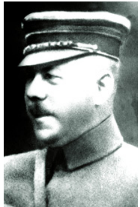
STROMFELD AURÉL 1878 - 1927

1919. augusztus 16-án a Friedrich-kormány rendeletben kimondta, hogy a "felállítandó nemzeti hadseregbe csak azok a tisztek, tisztjelöltek, hadapródjelöltek és hasonló állásúak vehetők fel, akiknek tökéletes megbízhatósága minden kétségen felül áll", ezért a tiszteket igazoló eljárás alá vonták, ahol meg kellett állapítani, hogy az illető "a tanácsköztársaság alatt és annak érdekében nem teljesített-e a köteles, illetve rákényszerített munkát meghaladó szolgálatot". Az igazolóbizottságok végül is meglehetősen szabad kezet kaptak "a köteles, illetve rákényszerített munkát meghaladó szolgálat" értelmezésében. Stromfeldet a tanácskormány bukása után elfogták, 1919