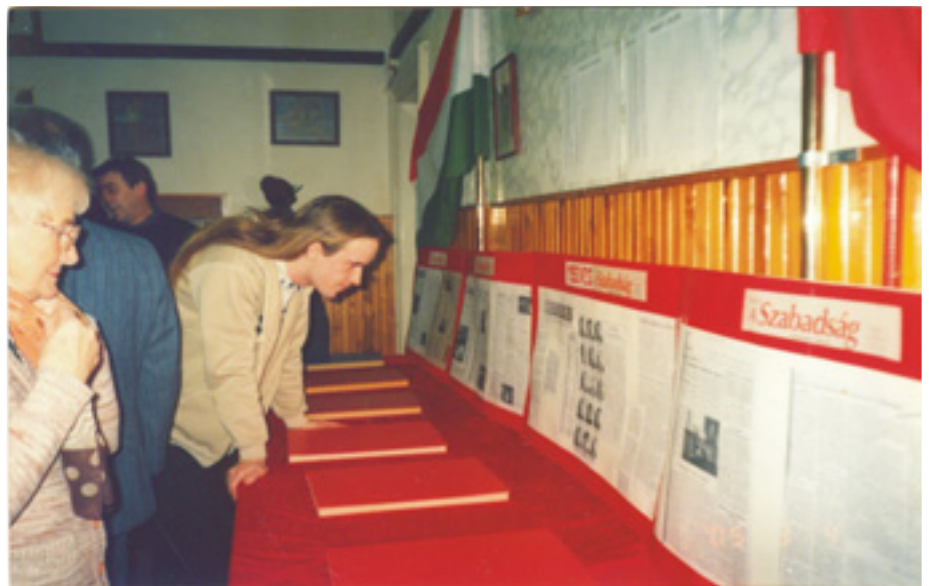
A SZABADSÁG ÚJSÁG MEGJELENÉSÉNEK 15. ÉVFORDULÓJA ALKALMÁBÓL RENDEZETT KIÁLLÍTÁSON AZ ILLÉS UTCÁBAN, A MUNKÁSPÁRT VIII. KERÜLETI SZERVEZETÉNél