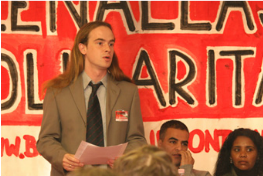
A BALOLDALI FRONT - KOMMUNISTA IFJÚSÁGI SZÖVETSÉG VIII. KONGRESSZUSÁN, MINT LEVEZETŐ ELNÖK

tén sok szempontból érdekes munka ez. Egyfelől készíti az embert, hogy naprakész legyen, másfelől rengeteg plusz információt ad, hogy tisztában lássuk a helyzetet. A Munkáspártban vezetőnek lenni tisztesség dolga, akár fiatal az ember, akár idősebb. Itt nem jár sokszázézes meg sokmillió fizetés, mint a parlamenti pártoknál és képviselőknél. A Munkáspártban viszont felelős és értelmes munkát kapsz, tudod, hogy a társaidnak szüksége van rád. Nem hiszem, hogy ennél van jobb dolog.