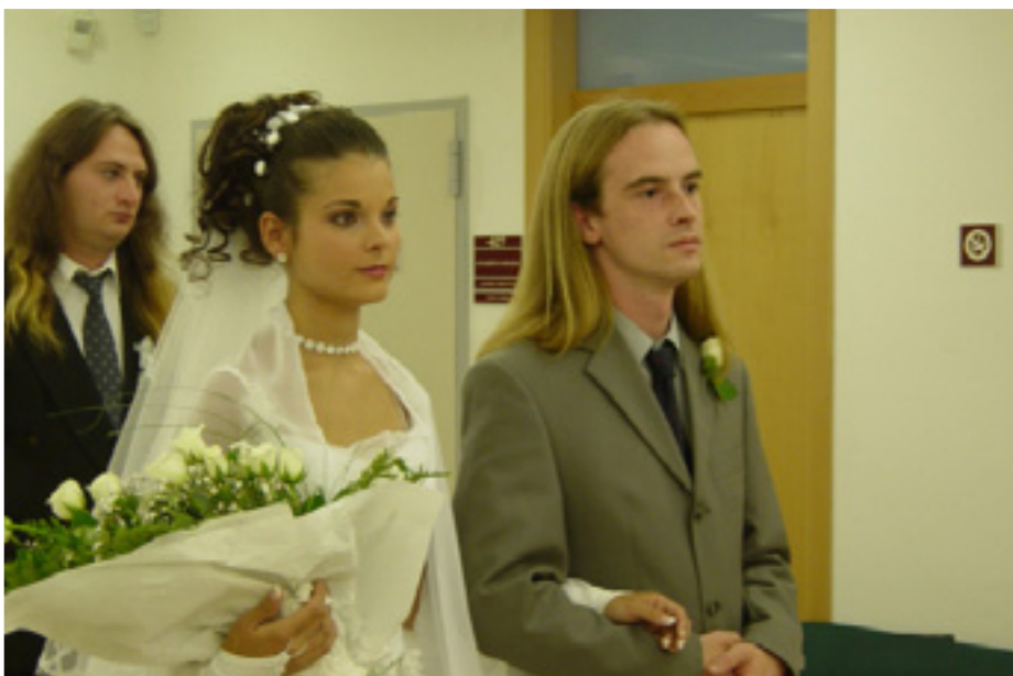
ESKÜVŐI KÉP 2002-BŐL

2001 környékén tudatosult bennem, a Munkáspárt az én pártom. Láttam a parlamenti pártok "szereplését",