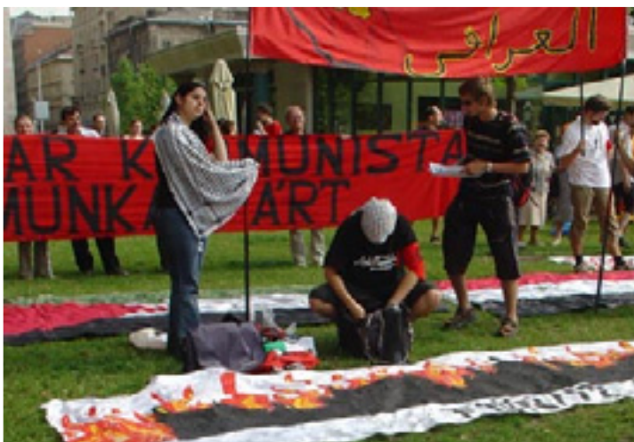
A MUNKÁSPÁRT ÉS A BALOLDALI FRONT TŰNTETÉSE BUSH LÁTÓGATÁSA ÉS AZ IRAKI HÁBORÚ ELLEN

A Munkáspárt felháborodással értesült Szekeres Imre honvédelmi miniszter bejelentéséről, miszerint a magyar kormány újabb 11 katonát küld Irakba.