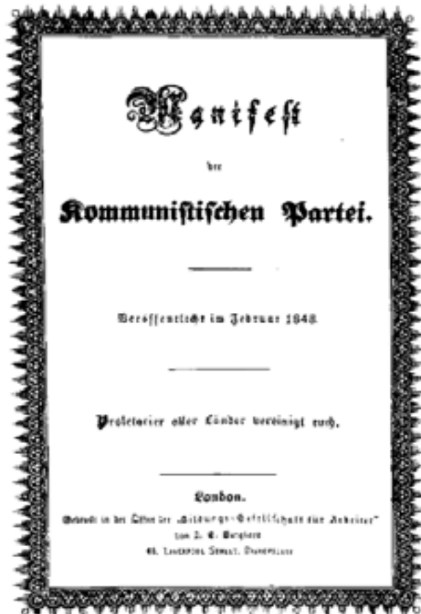
A KOMMUNISTA PÁRT KILÁLLTVÁNYÁNAK ELSŐ KIADÁSÁNAK BORÍTÓJA

A Magyar Kommunista Munkáspártnak ezt a folyamatot kell politikájával segíteni.